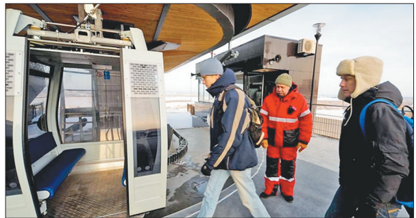
俄方达利涅列琴斯克市已经绘制出逼真的“索道效果图”。

林——吉祥国境段)”建设被摆上日程,洋洋几十万字、图文并茂的“预可行性研究报告”摆在决策者的案头。 隔乌苏里江与俄罗斯达利涅列琴斯克市仅400米的“天堑”,已经有望变成通途——“达利涅列琴斯克-虎头国际索道客运通道”不仅是双方热议的话题,已经被真正摆上日程,俄方达利涅列琴斯克市已经绘制出逼真的“索道效果图”。(下转第四版)