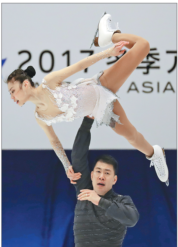
于小雨/张昊 获花样滑冰双人滑冠军