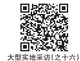
大型实地采访(之十六)