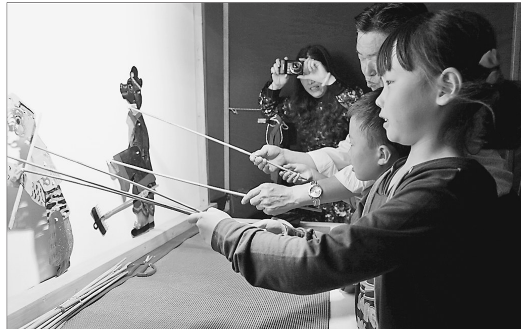
在孩子们的心中埋下传统文化的种子。

真正让传统文化热起来,不能只“取一瓢饮”,应该多渠道去打开传统文化的大门,尤其要通过不同的载体传播。黑龙江工程学院人文系副教授、苏州大学戏剧影视文学专业博士张宇认为,大众传播是保证传统文化有一定受众群体的一个基本条件。例如中国传统戏曲在电视传播、新媒体上“活”起来,还远远不够,还活跃在剧场舞台上,观众希望传统文化以最本真、最原始、