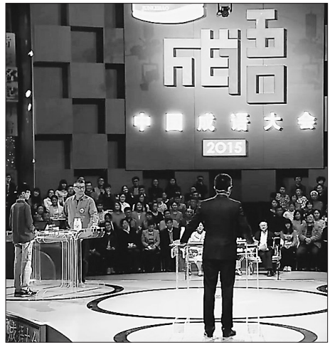
《中国成语大会》现场。

最近,中共中央办公厅、国务院办公厅印发了《关于实施中华优秀传统文化传承发展工程的意见》,为中华优秀传统文化的传承、弘扬、创新发展提供了“路线图”。如何坚持创造性转化和创新性发展,将中华民族最基本的文化基因与当代文化相适应,成为人们关注的热点。《中国汉字听写大会》《叮咯咙咚呛》第二季、《中国成语大会》《中国诗词大会》等节目先后掀起传统文化热潮后。传统文化如何在更为广阔的层面焕发新机?节目中选手们血拼诗词、成语储备量,比赛场面激烈好看之余引人思考,传统文化不仅是“泛读课”“精品课”,而应该是“日常课”,真正让传统文化热起来,不能只“取一瓢饮”,应该多渠道去打开传统文化的大门。