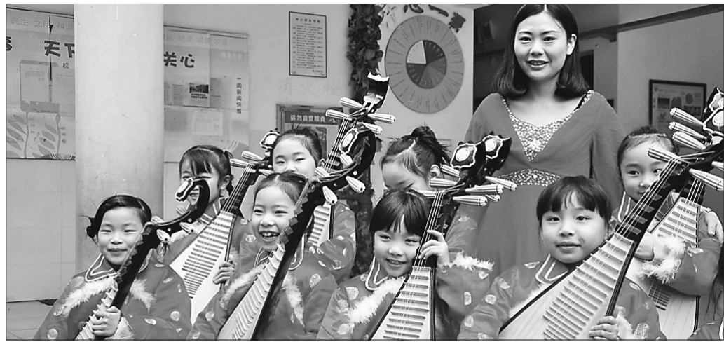
传统文化走进课堂。