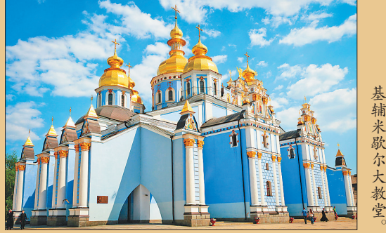
基辅米歇尔大教堂。

乌克兰驻华大使馆商务参赞谢尔杰契尼·亚历山大也表示,以后乌克兰也会开展类似的文化艺术交流活动,欢迎中国的艺术家去乌克兰做客,也期待两国开展更多领域的交流与合作。