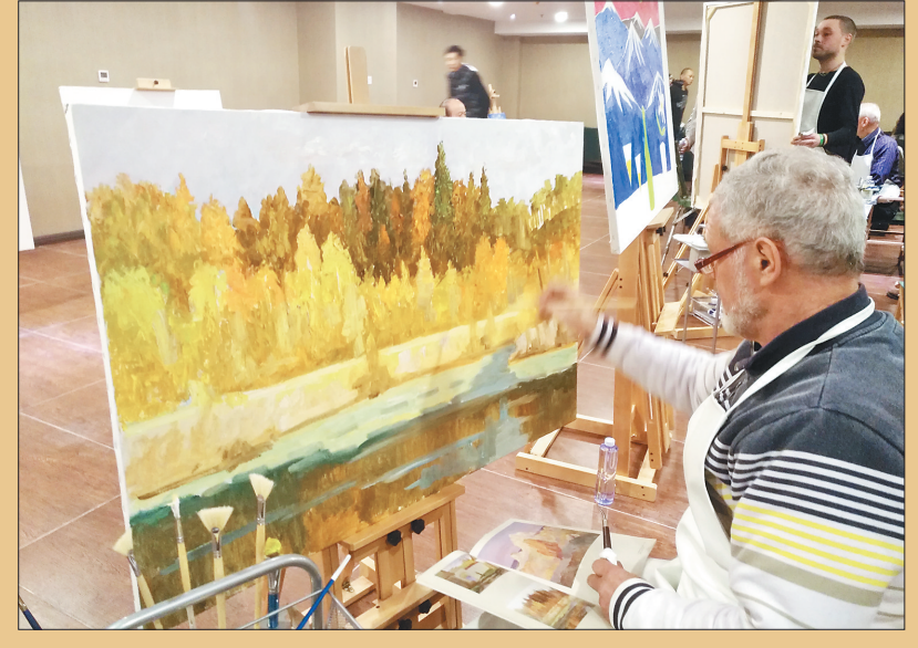
乌克兰艺术家在亚布力油画基地创作。

不久前,亚布力油画基地在亚布力温泉国际度假中心落成,其宗旨在于为乌克兰艺术家进行油画创作搭建平台,为中乌两国艺术家交流合作提供便利。 乌克兰驻华大使馆商务参赞谢尔杰契尼·亚历山大两年之中来过哈尔滨8次,却是第一次到亚布力,他对这里的自然景观和冰雪旅游很感兴趣。他说,此次有30余位乌克兰艺术家来到亚布力,堪称阵容强大。乌克兰在艺术创作方面有着悠久的历史,通过乌克兰艺术家的目光和作品来描绘亚布力、介绍亚布力、传播亚布力,会让更多的人感受到亚布力充满魅力的冬天,还有同样美好的春天、夏天和秋天。通过中乌艺术家的交流和合作,双方可以举办中乌艺术家作品展览或者其他形式的活动。 据悉,亚布力油画基地每年将有近百名中外画家在此生活创作,每年预计创作作品三千余幅,首批30余位乌克兰画家已经进驻,他们将通过油画创作,将龙江的冰雪元素传递到乌克兰乃至全世界。在今后的创作中,除了冰雪元素,他们还将作品中展现黑龙江不同季节的美景。 从亚布力温泉国际度假中心远眺,可见纵横的高山滑雪道,美景中作画,浑然天成。乌克兰画家们纷纷表示,这里是艺术创作的殿堂,在这么美的度假