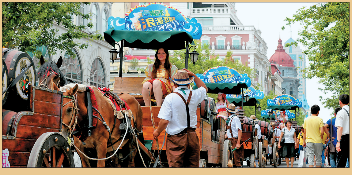
中俄文化交流活动领赏。

哈欧班列、陆海联运、“三桥一岛”……主动对接国家顶层设计,近几年,“龙江丝路带”建设可谓亮点频现。如果说,这些亮点正在夯实“龙江丝路带”硬实力的话,那么,作为联系政府、企业、市场之间的桥梁纽带,商协会活跃其间,则无疑成为一股不可或缺的力量。 省贸促会会长鄂忠齐认为,“一带一路”建设既需要硬件互联互通,更需要软实力的四通八达,加强丝路沿线各国贸易投资促进、商事法律服务等的沟通和交流。而民间组织和社会力量是理想的“纽带”,可以拓宽“一带一路”触角,把倡议务实融入到经贸、人文合作的基础层面,成为推动各国、各地区开展宽领域、多渠道、多层次合作的重要途径。近几年,省贸促会和省国际商会发挥“亦官亦民”的优势,努力打造与“龙江丝路带”发展战略相匹配的贸易投资促进主渠道,为其注入“软实力”。