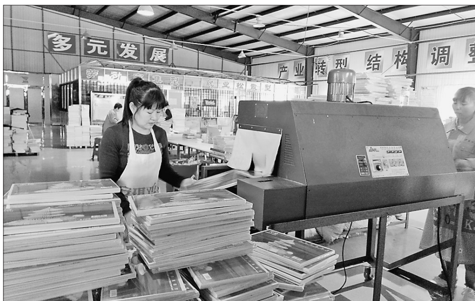
柴河局工业园开工。

2017年森工工作会议提出,要总体上实施“486”规划布局,即划分北部林区种植经济,东部林区养殖经济,南部林区食用菌、林药经济,中部林区森林旅游经济4大板块;发展种植养殖、营林、森林旅游、森林食品、木材精深加工、绿色矿产、林药、建筑8大产业;加速形成森林旅游产业,森林绿色食品产业、种植加工产业、养殖加工产业、林药产业、林产业6条产业链。初春时节,万物复苏,森工各地“摩拳擦掌”,开始谋划产业布局新篇章。