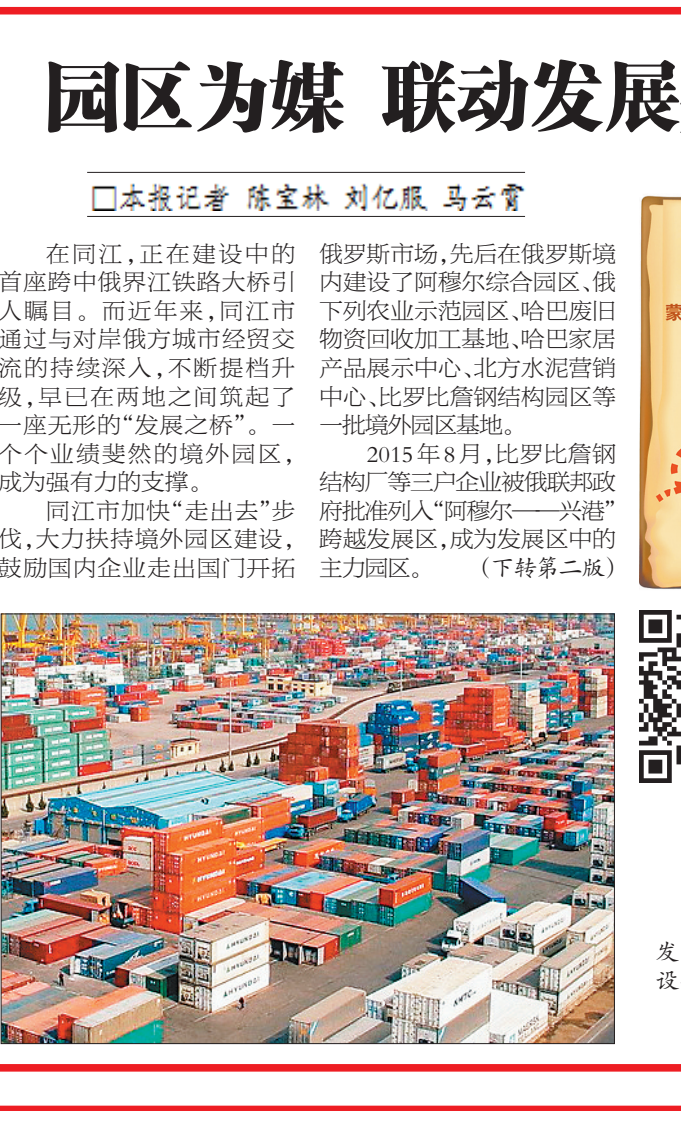
同江经济开发区物流中心建设项目。

陆昊作任职议案说明 本报5日讯(记者闫紫谦)5日上午,省十二届人大常委会第三十三次会议在哈尔滨召开。 省人大常委会党组书记、副主任符凤春,副主任孙永波、胡世英、庞义华、朱清文,秘书长于柏青出席上午举行的第一次全体会议;省人大常委会党组书记、副主任赵敏主持会议。 省委副书记、省长陆昊作《黑龙江省人民政府关于提请毕宝文等任职议案的说明》。省委常委、副省长李海涛列席会议,并作《黑龙江省人民政府关于省人大常委会行政许可“一法一例”实施及优化发展环境监督检查情况的通报研究处理情况的报告》。省高级人民法院院长石时态、省人民检察院检察长徐明列席会议,并分别作有关人事任免情况的说明。 会议听取了《黑龙江省禁毒条例(草案)》《黑龙江省税收保障条例(草案)》《黑龙江省村民委员会选举办法(修订草案)》《黑龙江省人大常委会关于促进全民阅读的决定(草案)》的说明,《黑龙江省人大常委会代表资格审查委员会关于补选代表的代表资格的审查报告》、有关任免部分法职人员议案审议结果的报告。 会议审议了哈尔滨、佳木斯、大庆、双鸭山、黑河市人民代表大会及其常务委员会立法条例和鸡西、绥化市人民代表大会及其常务委员会制定地方性法规条例,《黑龙江省人民政府关于2016年节能减排工作情况的报告(书面)》等。 拟任职人员作供职发言。 列席会议的还有省人大各专门委员会组成人员,省人大常委会各工作机构、办事机构以及有关部门负责人;各市人大常委会、大兴安岭地区人大工委和绥芬河市、抚远市人大常委会负责同志;部分全国人大代表、省人大代表也列席了会议。省政府有关部门负责同志到会听取意见和建议,部分公民代表旁听会议。