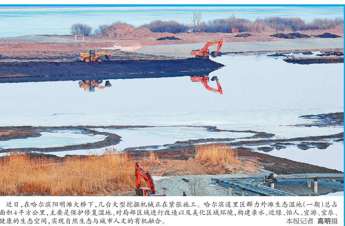
近日,在哈尔滨阳明滩大桥下,几台大型挖掘机械正在紧张施工。哈尔滨道里区群力外滩生态湿地(一期)总占地面积4平方公里,主要是保护修复湿地,对局部区域进行改造以及美化区域环境,构建亲水、近绿、怡人、宜游、宜乐、宜健康的生态空间,实现自然生态与城市人文的有机融合。

本报5日讯(贾辉)5日下午,省委书记张庆伟主持召开省委常委会议,传达学习习近平总书记系列重要讲话精神,会议强调,习近平总书记系列重要讲话精神是指引龙江全面振兴发展的总纲领、总遵循、总指南。习近平总书记最近对黑龙江作出的重要指示,充分体现了对龙江工作的高度重视,体现了对龙江干部的亲切关怀和殷切希望,体现了对龙江发展的大力支持。我们一定要一体学习领会、把握核心要义、深入贯彻落实,进一步增强“四个意识”,提高向习近平总书记看齐、向党中央看齐的思想自觉和行动自觉,坚决同以习近平同志为核心的党中央保持高度一致,不断把学习习近平总书记系列重要讲话精神和对我省的重要讲话、重要指示精神引向深入。 陆昊、黄建盛、张效廉、陈海波、王常松、李海涛、李雷、孙尧、甘荣坤、王爱文、张雨浦出席会议。杜宇新、符凤春列席会议。 会议强调,要旗帜鲜明讲政治,切实把思想认识统一到习近平总书记的重要讲话和重要指示精神上来。牢固树立“四个意识”特别是核心意识、看齐意识,坚决维护以习近平同志为核心的党中央权威,坚决维护党的团结和集中统一领导。把学习贯彻落实习近平总书记系列重要讲话精神和对我省的重要讲话、重要指示精神,作为首要政治任务,作为首要责任,作为首要任务,带着感情学、持续深入学、联系实际学,真正学深悟透、知行合一,激发内生动力、坚定发展信心,撸起袖子加油干,投身龙江全面振兴发展的伟大实践。 会议强调,要加强省委常委班子自身建设,接好龙江事业发展的“接力棒”。坚持继承、创新、发展,以功成不必在我的境界、钉钉子的精神,抓好习近平总书记“四个坚持”要求落地,一任接着一任干,一张蓝图绘到底,夙夜在公、拼搏实干,奋力走出全面振兴发展新路子。充分发挥统揽全局、协调各方作用,常委一班人带头讲政治、顾大局、重团结,做到打铁还需自身硬。 会议强调,要抓好党风廉政建设建设和领导干部廉洁自律,推动政治生态持续好转。一级做给一级看,一级带着一级干,带头严守中央八项规定精神,带头廉洁自律,以“关键少数”带动全省各级党组织和广大党员干部全面落实全面从严治党要求。以案为鉴,以“零容忍”态度惩治腐败,驰而不息反“四风”、转作风、树新风,营造风清气正的政治生态,为龙江全面振兴发展提供坚强政治保证。 会议传达了学习了习近平总书记到中央政治局会议听取2016年省级党委和政府脱贫攻坚工作成效考核情况汇报时的重要讲话精神,强调要深化思想认识,坚持问题导向,坚持精准施策,层层压实责任,确保我省脱贫工作取得实效。 会议听取了省第十二次党代会筹备工作有关情况汇报,强调要提高政治站位,确保工作质量,严格落实责任,加强统筹协调,严肃换届纪律,把省十二次党代会开成一个凝心聚力的大会、团结奋进的大会、风清气正的大会。 会议决定,中国共产党黑龙江省第十一届委员会第九次全体会议于2017年4月18日在哈尔滨召开。 省直有关部门主要负责同志列席会议。