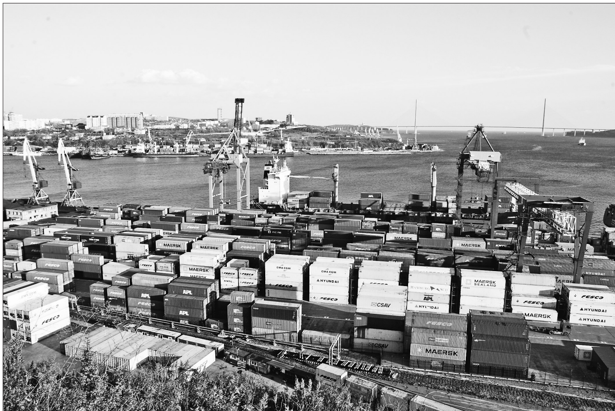
俄罗斯符拉迪沃斯托克港口内，由绥芬河转运至此的货物集装箱在等待出海。