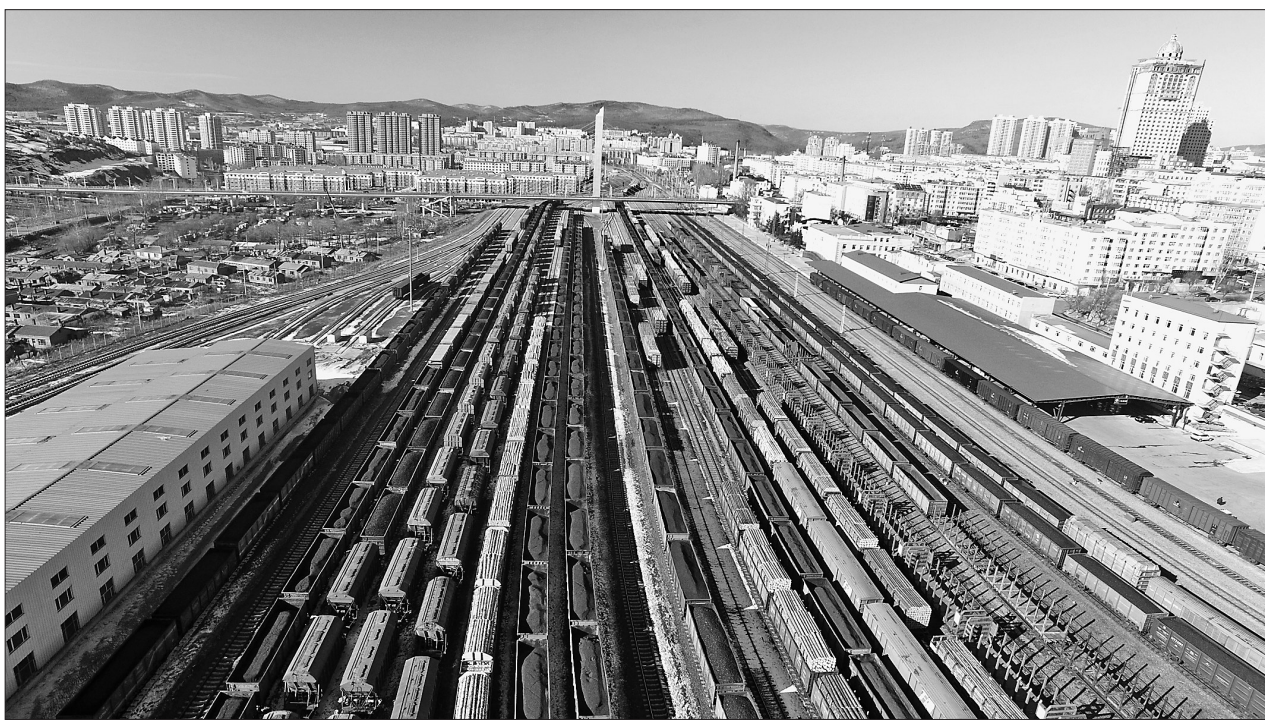
川流不息的铁路货场专列密布。

通过对“哈绥符釜”陆海联运大通道运营过程中重要节点的梳理，我们能够一同见证这条通道从最初“摸着石头过河”到如今旺季时“一箱难求”的发展历程。