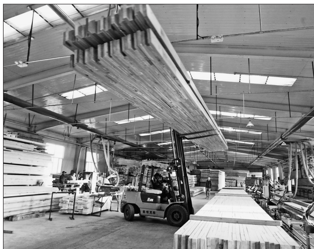
绥芬河木业企业生产的家具制品将借港出海。

日前，记者走进绥芬河益昌晟木业有限公司，只见几十名工人正在生产线上加紧生产，正在生产的这批沙发、家具龙骨，