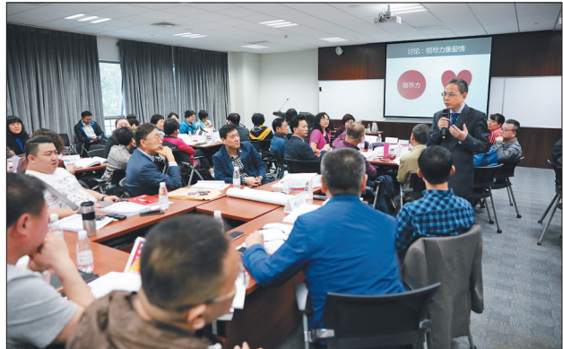
培训班的学员们在进行专题培训。