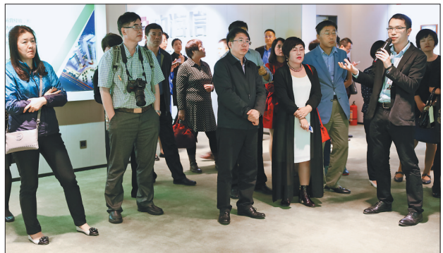
培训班的学员们在企业参观学习。