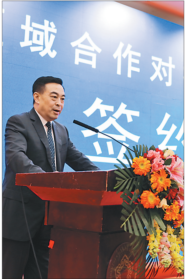
香坊区在深圳举办的区域合作对接会暨产业项目签约仪式现场。

今天的项目数量,就是明天的经济总量,这标志着香坊区与深圳开展深层次经贸交流合作的开始。这批项目的集中签约落地,标志着香坊区初步与深圳建立对口合作关系,将进一步壮大该区的经济实力,加快该区“四区”建设步伐。其中,分别由恒大集团和宝能投资集团投资建设的恒大中央广场项目和宝能现代城项目,将拉开国内的世界500强企业参与香坊区老工业区搬迁改造的序幕。