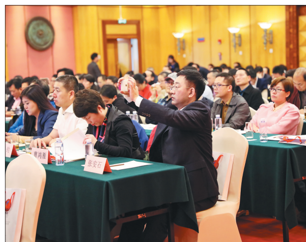
香坊区在深圳进行项目推介。