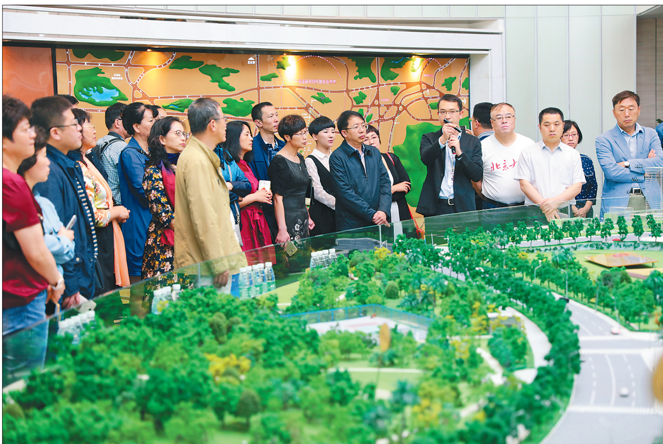
培训班的学员们在企业参观学习。

据悉,第一期培训期间,香坊区政府与深圳北京大学汇丰商学院签署了长期战略合作协议。香坊区委区政府将拿出100万元的专项培训经费,对企业进行重点培训,以开阔企业家视野,提升企业价值,进而提振香坊经济,为东北振兴做出更大贡献。