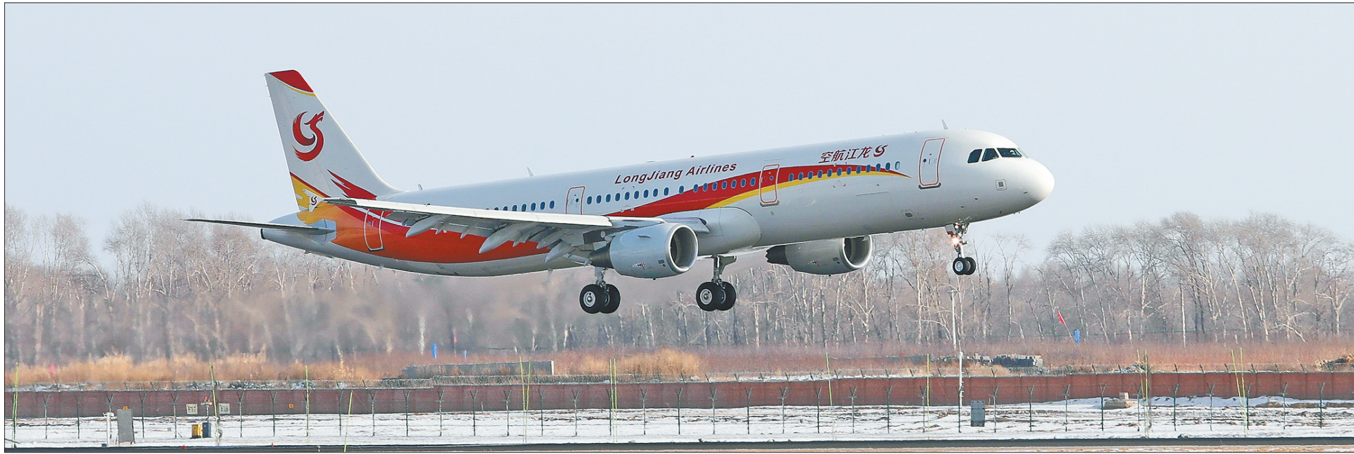
在区域良好发展环境的吸引下,省内首家本土航空公司——龙江航空已落户香坊区。

深圳之行,收获颇丰。香坊区学习考察团在接受了领导干部创新发展系统培训的同时,赴深圳前海自贸区、华为总部及中海信创新产业城进行了实地考察,与深圳市相关区进行合作对接,学习其转型经验和创新思维,签署了友好合作协议,签订了总投资额达200亿元的10个合作项目。该活动让香坊区干部增长了知识,拓宽了视野,提高了执政能力和水平,为香坊区实施工业强区战略、推进“四区”建设,实现全面振兴发展找到“金钥匙”。