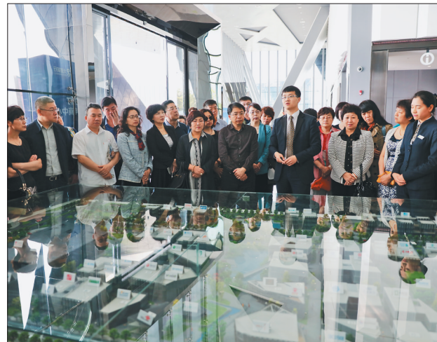
培训班的学员们在企业参观学习。