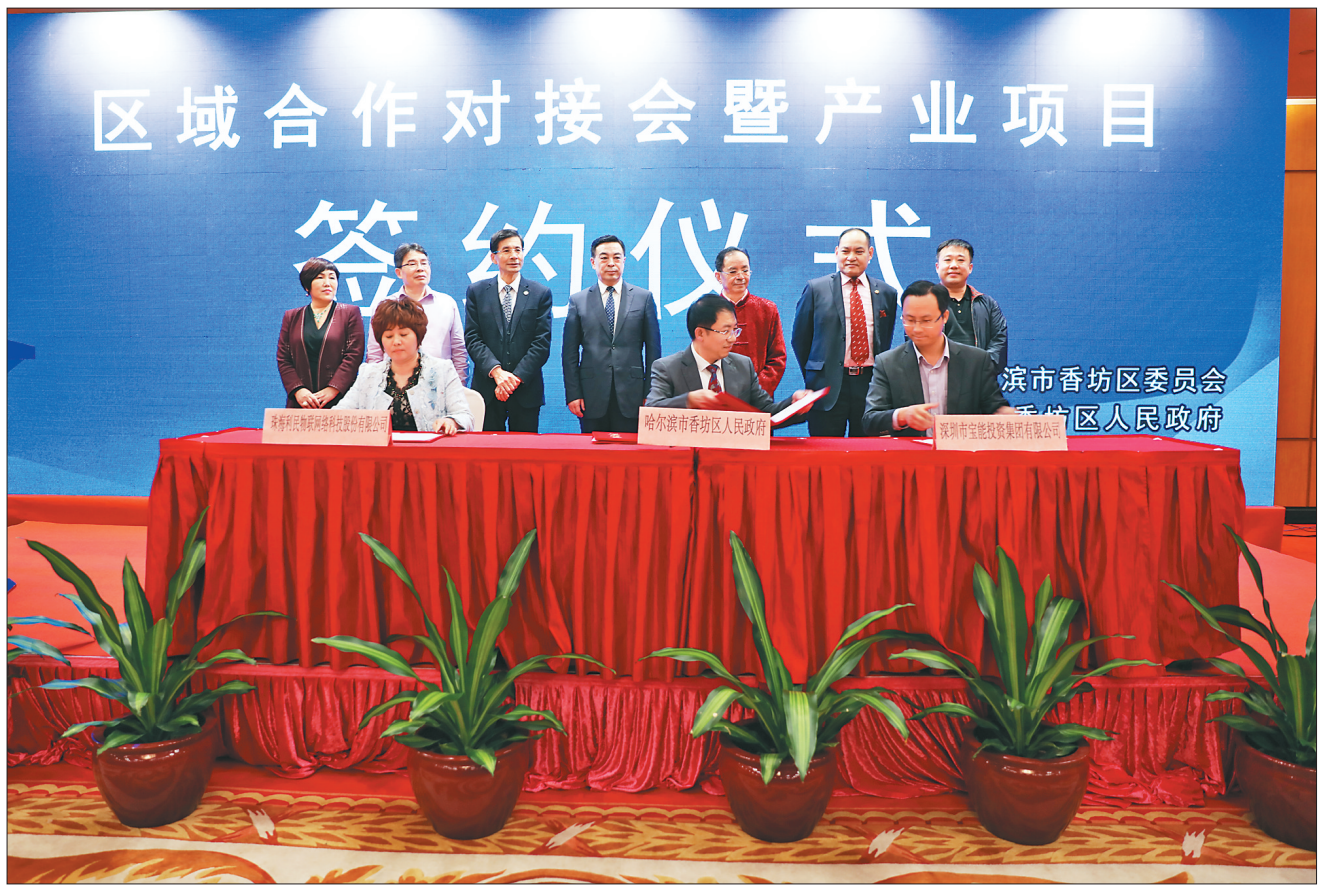
香坊区在深圳进行项目签约。