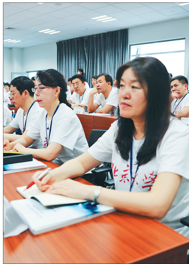
培训班的学员们在进行专题培训。