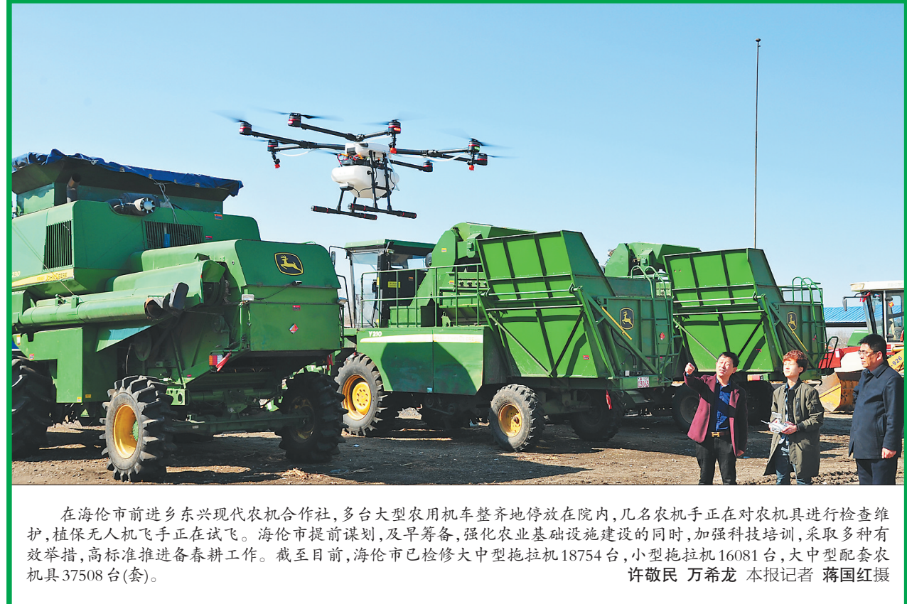
在海伦市前进乡东兴现代农机合作社,多台大型农机整齐地停放在院内,几名农机手正在对农机具进行检查维护,植保无人机手正在试飞。海伦市提前谋划,及早筹备,强化农业基础设施建设的同时,加强科技培训,采取多种有效举措,高标准推进春耕工作。截至目前,海伦市已检修大中型拖拉机18754台,小型拖拉机16081台,大中型配套农机具37508台(套)。

省委省政府先后召开专题会议,高规格、大视角、系统性地部署发展冰雪旅游为龙头的冰雪产业,对建设冰雪经济强省工作进行顶层设计。(下转第二版)