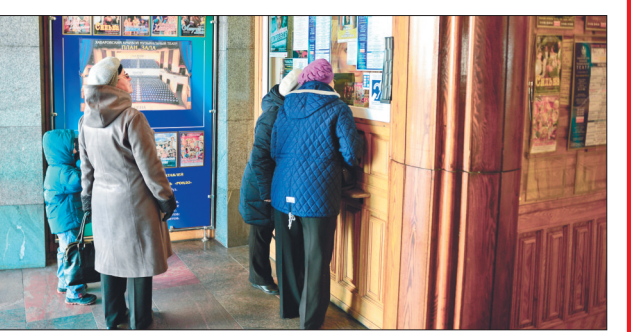
杨廷制图 观众购票准备观看演出。