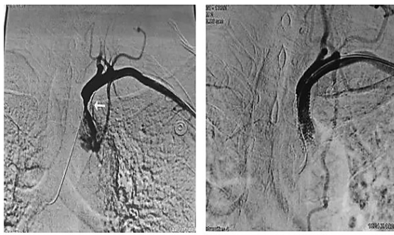
术前造影显示狭窄处 术后造影显示恢复血流