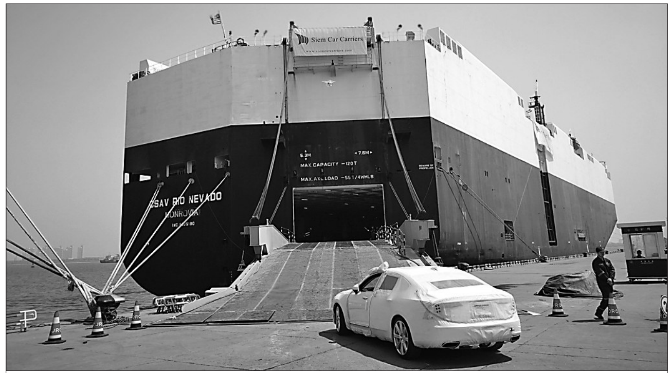
24日,大庆沃尔沃汽车制造有限公司生产的400余辆全新S90长轴距版豪华轿车在天津港环球滚装码头装船启运,预计5月20日抵达目的地美国怀尼米港。4月12日,这批豪车从大庆出发,拉开“大庆造”高端豪车首次出口全球市场的序幕。