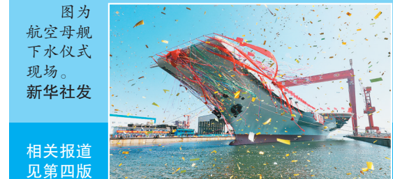
图为航空母舰下水仪式现场。