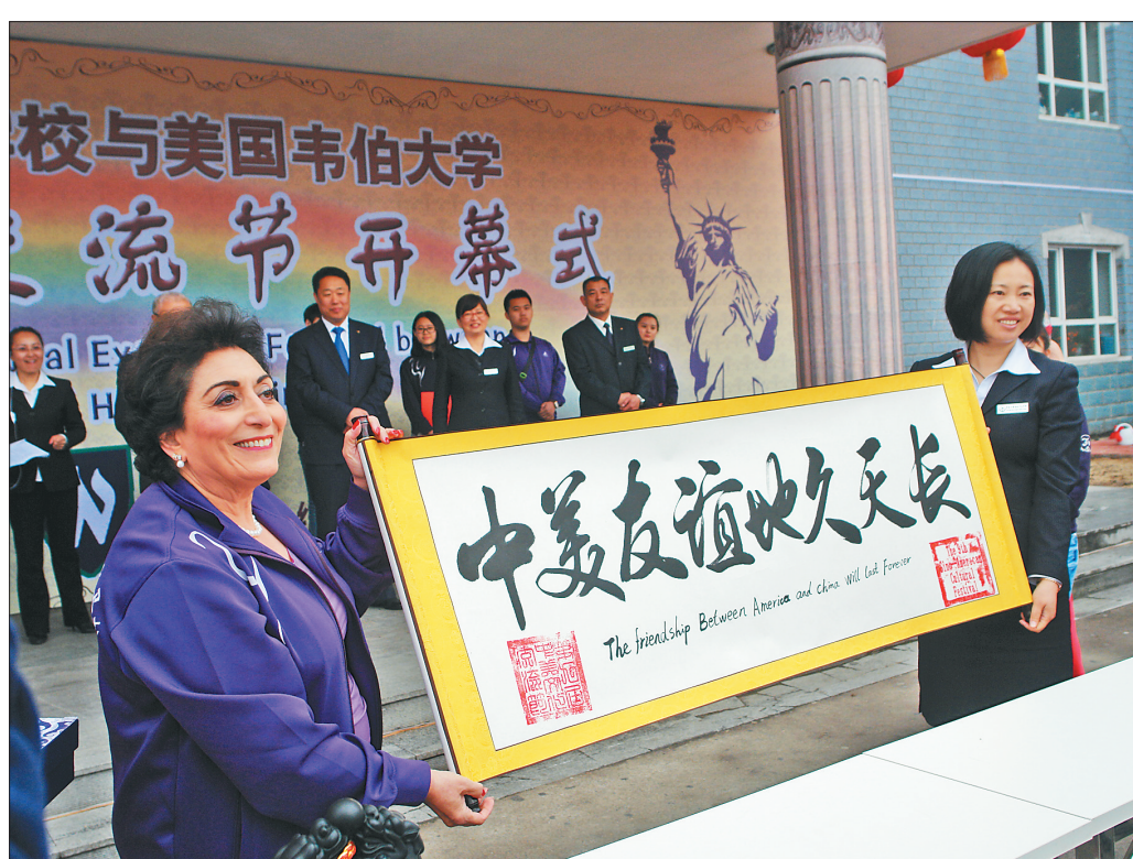
黑龙江省林业卫生学校和美国韦伯大学在文化交流节上互赠礼物。

此一家。眼视光与配镜专业全部毕业生被中国宝岛眼镜公司录用,口腔护理专业毕业生全部就业于京、沪、杭高端口腔医院。并且,实现了带薪实习、高薪就业的技能人才就业目标。 护理专业学生的护士执业资格证,就是从事护理工作上岗证,护士执业资格考试的通过率直接推动着护理专业学生的顺利就业。在全国统考平均通过率仅为40%左右的情况下,学校连续11年突破90%,2015年达93.2%,2016年达90.2%,全国同院校领先。护理专业学生的专业对口就业率也连续11年突破90%。 全面系统地开展专业建设,学校办出了规模,办出了成效,办出了特色,促进学校办学水平的整体提升,为国家未来产业发展培养了更多优秀的高素质人才。按照“必须、够用、先进”原则,突出职业道德和实践能力的培养,提高了人才培养质量和办学效益,增强学校为区域经济社会发展服务的能力。