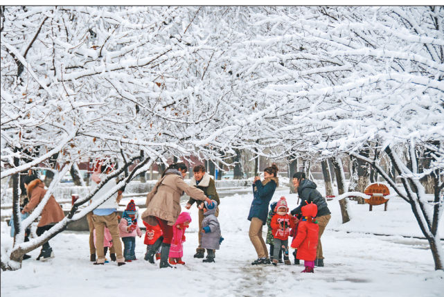
佳木斯冬景。