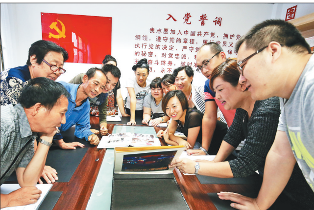
佳木斯向阳区九洲社区新型文化阵地。