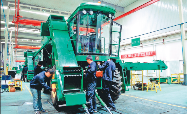
常发佳联农机总装线。