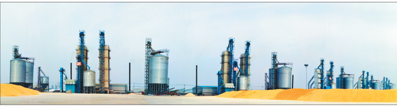
富锦象屿金谷打造世界级智能“大粮仓”。