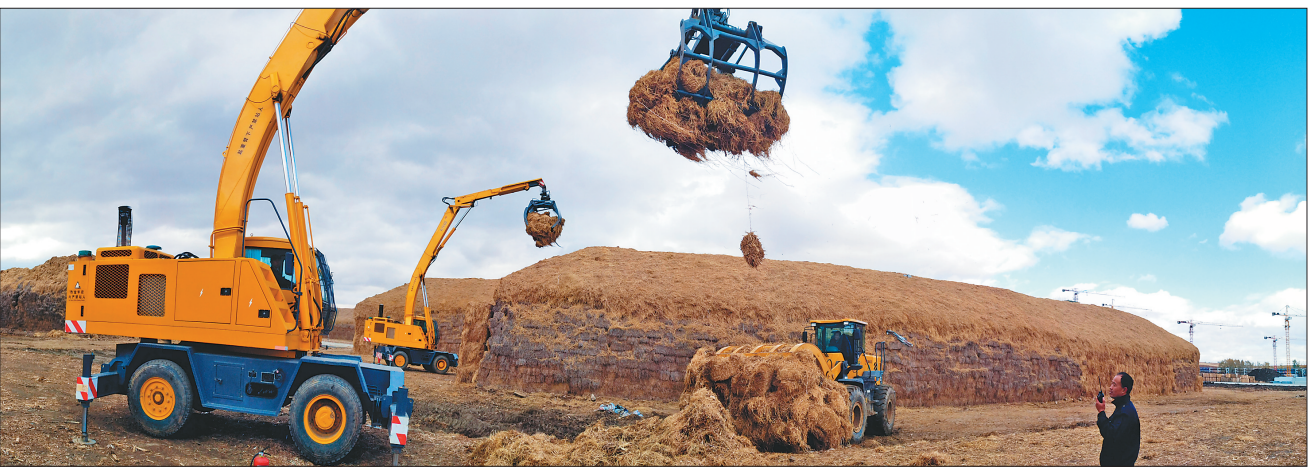
黑龙江泉林生态农业有限公司秸秆收储场。

站在新的起点上,佳木斯坚定不移推进公平共享,增进更多民众福祉。 统计显示,过去五年,佳木斯累计投入民生资金621.1亿元,占一般公共预算支出的63.4%。坚持以创业带动就业,持续增加城乡居民收入,预计2016年城乡居民人均可支配收入分别达24415元和13913元,分别比2011年增加9254元和4882元。 “衣食住行”,“住”占了重要的分量,是民生为先的基本要求。佳木斯大力推进城中村、棚户区、老旧小区、农村危房改造,城乡群众住房条件得到极大改善。 病有所医,共享优质医疗,也是佳木斯向民生项目倾斜的一种体现。在全省率先实行新农合异地就医即时结算,5家医院通过三级甲等医院审核,新建改建村卫生室405个,医疗卫生服务能力和水平不断提高。居民看病难问题得到较大缓解。 食在佳木斯,“平安佳木斯”建设深入推进,食品药品监管和安全生产工作持续加强,连续五年被评为中国十佳食品安全城市,社会安定有序。 义务教育全面实行阳光招生、阳光分班,整合撤并151所学校,新建和改造校舍178所,全部取消农村学校小火炉供暖,教育发展更加公平均衡。 未来五年,佳木斯将不断解决好人民群众普遍关心的突出问题,以实实在在的工作成效增进人民群众获得感。 城乡居民人均可支配收入年均增长6.5%左右,社会消费品零售总额年均增长10%左右,基本公共服务均等化和社会保障水平稳步提升,圆满完成脱贫攻坚任务,“十三五”,佳木斯志在高水平全面建成小康社会。 突出产业扶贫,激活造血功能,统筹推进教育扶贫、健康扶贫、社会保障扶贫和转移就业扶贫,确保到2019年底全市农村贫困人口全部脱贫,4个国家级贫困县全部摘帽。同时,着力加快民族地区发展,积极支持赫哲族群众先奔小康。 着力增加城乡居民收入,让百姓腰包更鼓。创新体制机制,落实创业扶持政策,改善创新创业要素保障,构建创业生态,建设符合地方特色产业发展方向、覆盖城乡的创新创业服务体系。 着力优化城乡公共服务。完善学前教育配套政策,继续推进义务教育优质均衡发展,落实特殊教育提升计划,推动民办教育特色化发展,立足区域产业特点,以市场为导向发展职业教育,不断改善办学条件,办好人民满意教育。 保障食品药品安全,严厉打击食品药品违法违规行为,创建国家级食品药品安全城市。扎实推进“平安佳木斯”建设,完善立体化社会治安防控体系,依法防范和惩治违法犯罪活动,不断提升群众安全感和满意度。