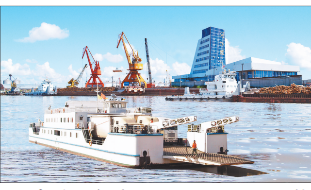
四季通航的口岸优势。