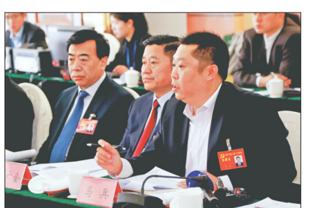
各代表团讨论张庆伟同志代表十一届省委向大会作的报告。