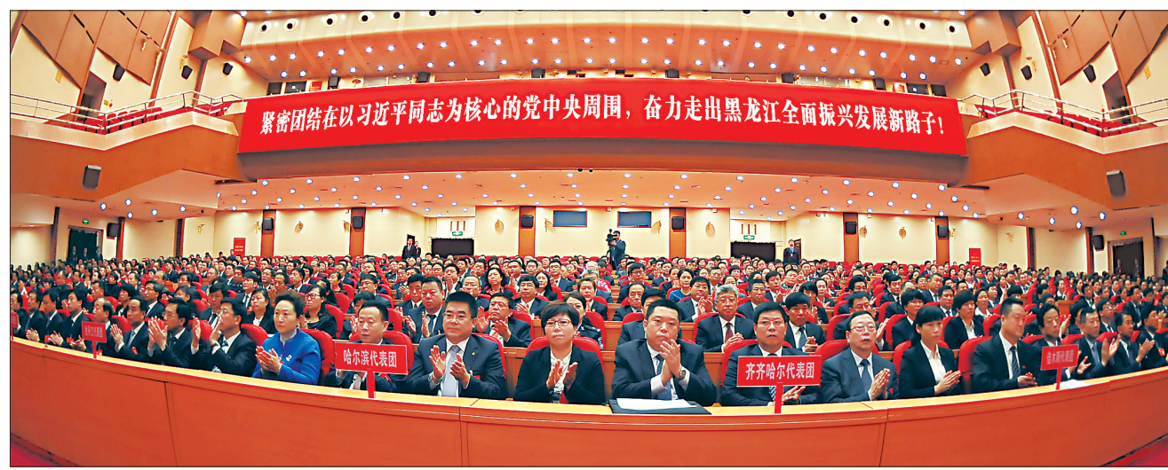
中国共产党黑龙江省第十二次代表大会闭幕会场。