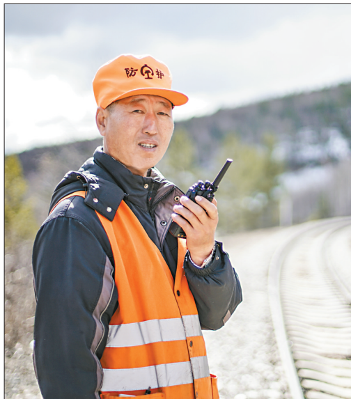
坚守时间最长,当年的小艾变成老艾。