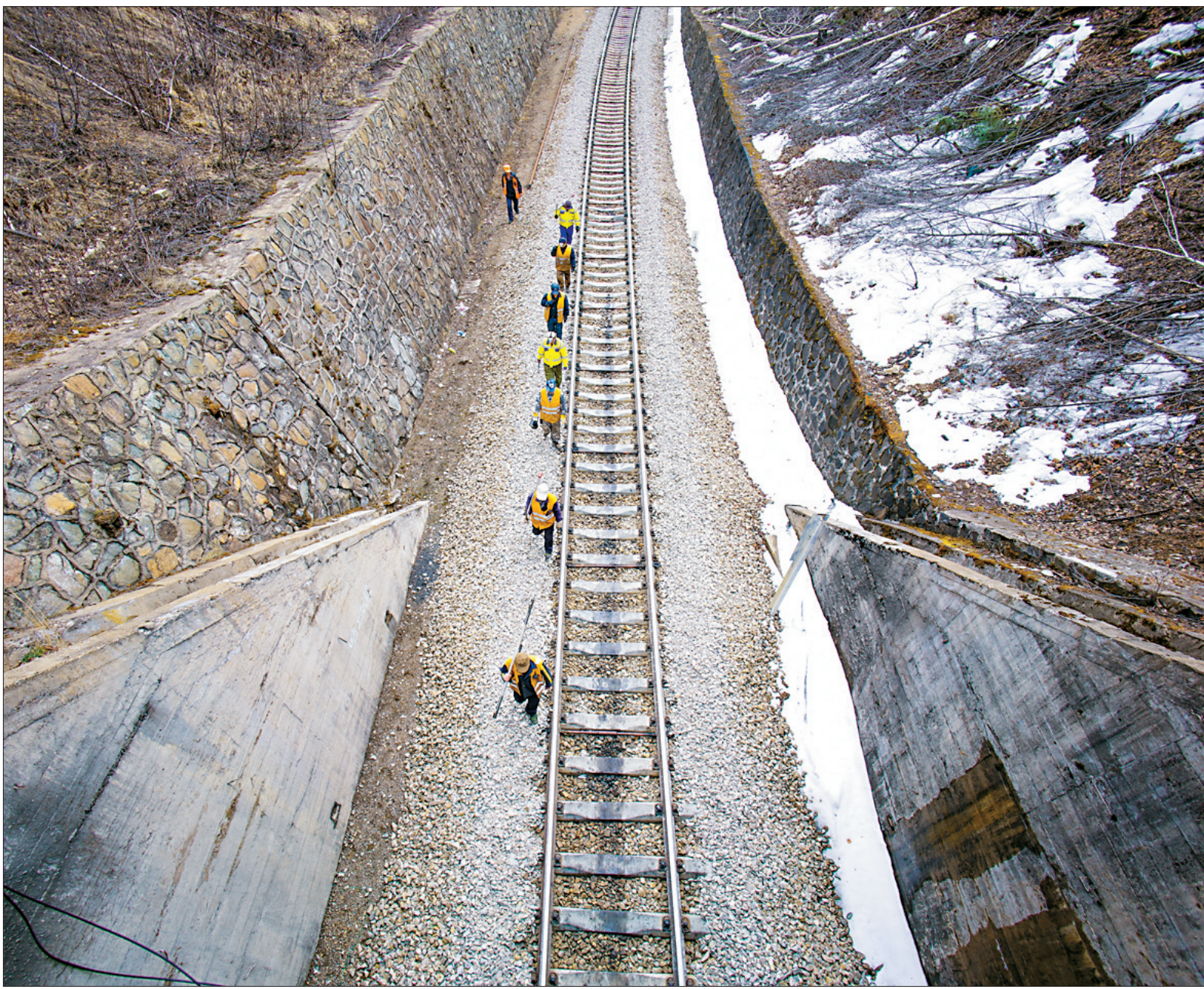
不知疲倦地行走,忠诚守护大山深处的“生命线”。

初春的大兴安岭,目之所及万顷林海,清新静谧,让人陶醉,而加格达奇工务段西罗奇线路工区的13名“守隧人”却无暇顾及眼前的风景,正沿着山中铁路忙碌着。