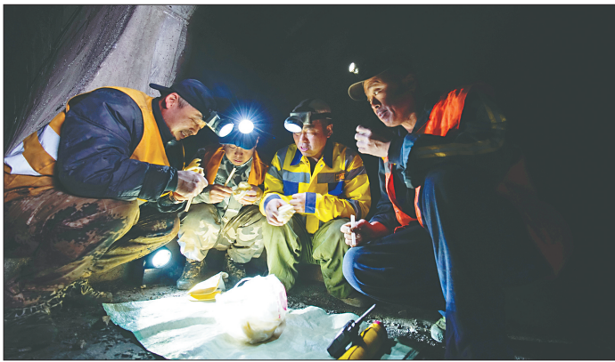
风餐露宿,对他们来说已是习以为常。