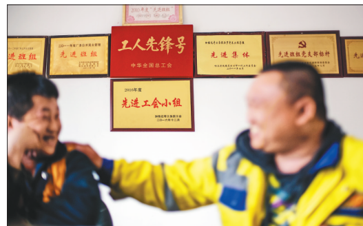
满墙奖状是对这群硬汉最好的嘉奖。