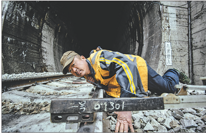
一毫米的误差也许酿成大祸,每次巡检大家都格外仔细。