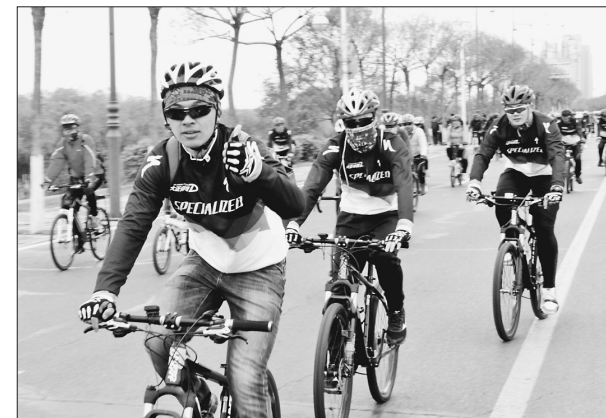
近日,由省体育局、省总工会、哈尔滨市政府主办,哈尔滨市体育局、哈尔滨市体育总会承办的松花江湿地自行车系列活动启动仪式,在哈尔滨市政府广场举行。本次活动作为哈马运动季内容之一,同时拉开黑龙江省夏季八大精品体育赛事的帷幕。图为市民踊跃参加自行车骑行活动。