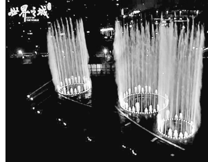
世界贸易中心协会,这将为哈尔滨带来联通世界的贸易发展机遇。在发展经济的同时,华鸿世界之城更建造亚洲最大的室内主题游乐商城——华鸿·欢乐城来丰富人们的生活。

除此之外,北京华鸿集团携手中信集团斥资200亿元,共同为哈尔滨打造的300万平方米世界美好城市旅游目的地——华鸿·世界之城!作为国家“一带一路”战略、中蒙俄经济走廊重点规划项目,华鸿·世界之城致力于打造冰城“城中城”。北京华鸿集团已于2015年2月19日成功申请加入了