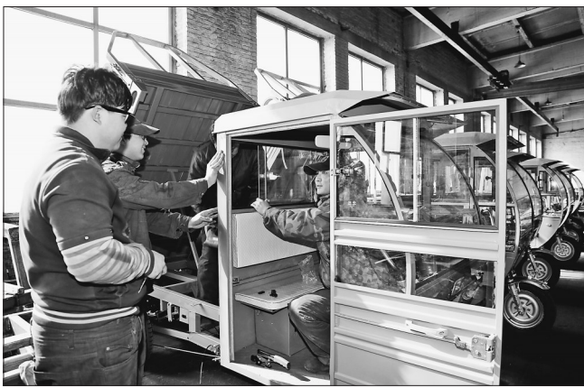
鹤北机修厂的电瓶车生产项目。

对全局单位实施半自立、全自立改革,事业单位企业化运营,鼓励科室、小微企业、个人创业创新,以“双创”激发新动能新活力。党员干部带头创业,使全局各单位真正转起来。尤其是贮木场、汽运处、机修厂亟待转型单位,通过一年多的“双创”实践,全面成功转型。贮木场开办养猪场、果蔬采摘园,参与粮食仓储项目,森林抚育实现了全员就业。机修厂通过代理制造电瓶车、洒水车、清雪车、焊接修理、废品收购等产业项目。汽运处通过与黑龙江省科学院、吉林农大等科研院所科技创新项