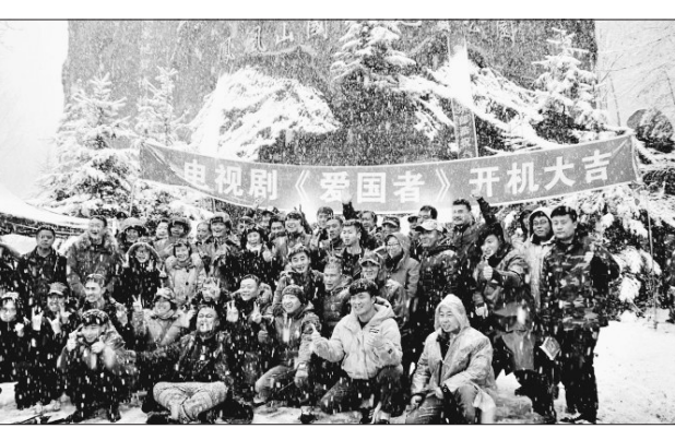
抗联剧《爱国者》在凤凰山开机。

柴河林业局的威虎山九寨景区4月29日才正式开园,而刚刚过去的两个周末,景区游客接待量均已超过千人。在威虎山九寨景区,游客们可以远离城市的喧嚣,吸高氧空气,听鸟鸣泉音,享森林馨香,抛开烦恼与疲惫,赏春、游玩、拍照,尽享乍暖还寒的别样温暖。游客还可以自驾进入景区,体验不一样的威虎山九寨之旅。