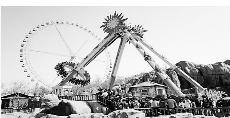
亚布力山地游乐园。