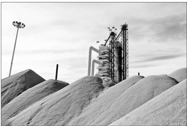
鹤北“双百万”粮食仓储项目。

抢抓“两山经济”制高点,利用林区的资源禀赋,向卖风景、卖服务、卖健康型产业转变。今年重点打造以鹤北局址为中心