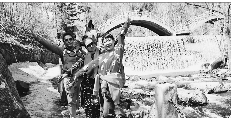
柴河威虎山九寨景区游客合影。

为了让更多游客了解亚布力滑雪旅游度假区,4月29日至6月4日期间,亚布力熊猫馆、山地游乐园、锅盔山景区3景点联合优惠,更有森林温泉、山地自行车等收费景点,以及敬佛山、环湖栈道、五小连池和好汉泊等免费景点供游客参观游览。走出喧嚣的城市,到亚布力去呼吸新鲜纯净的空气,舒缓压力,储备能量吧。