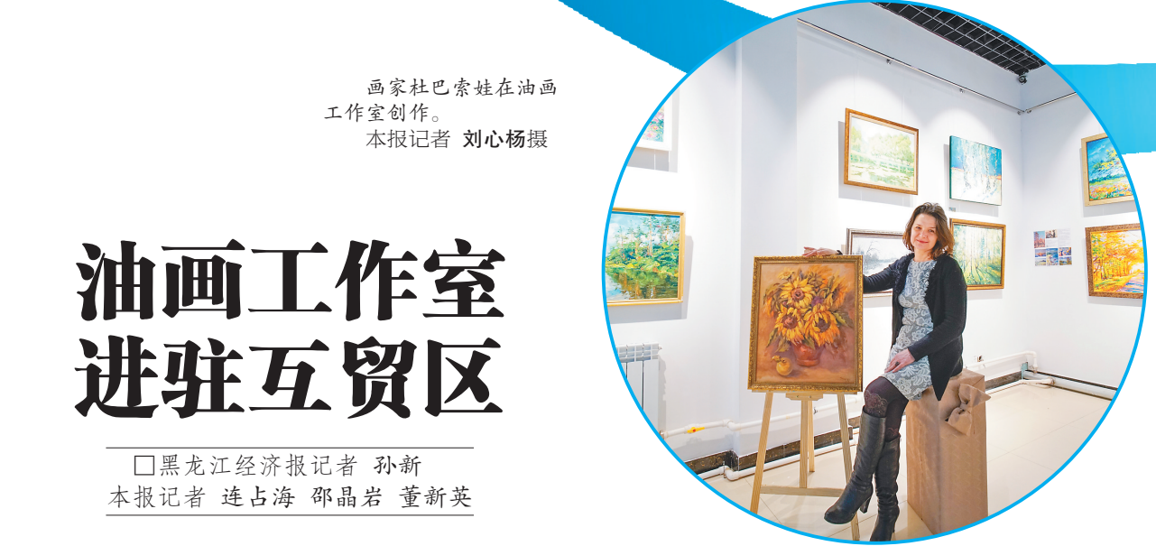
画家杜巴索娃在油画工作室创作。