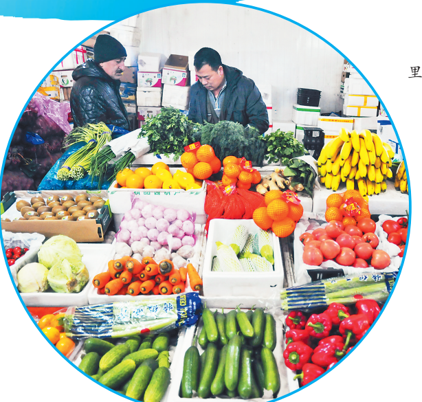
在友谊果蔬批发市场里,水果蔬菜琳琅满目。