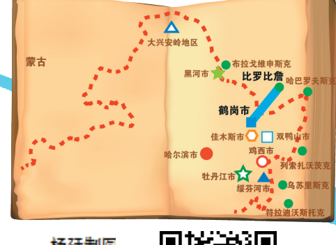
杨廷制图 大型实地采访 (三十三)