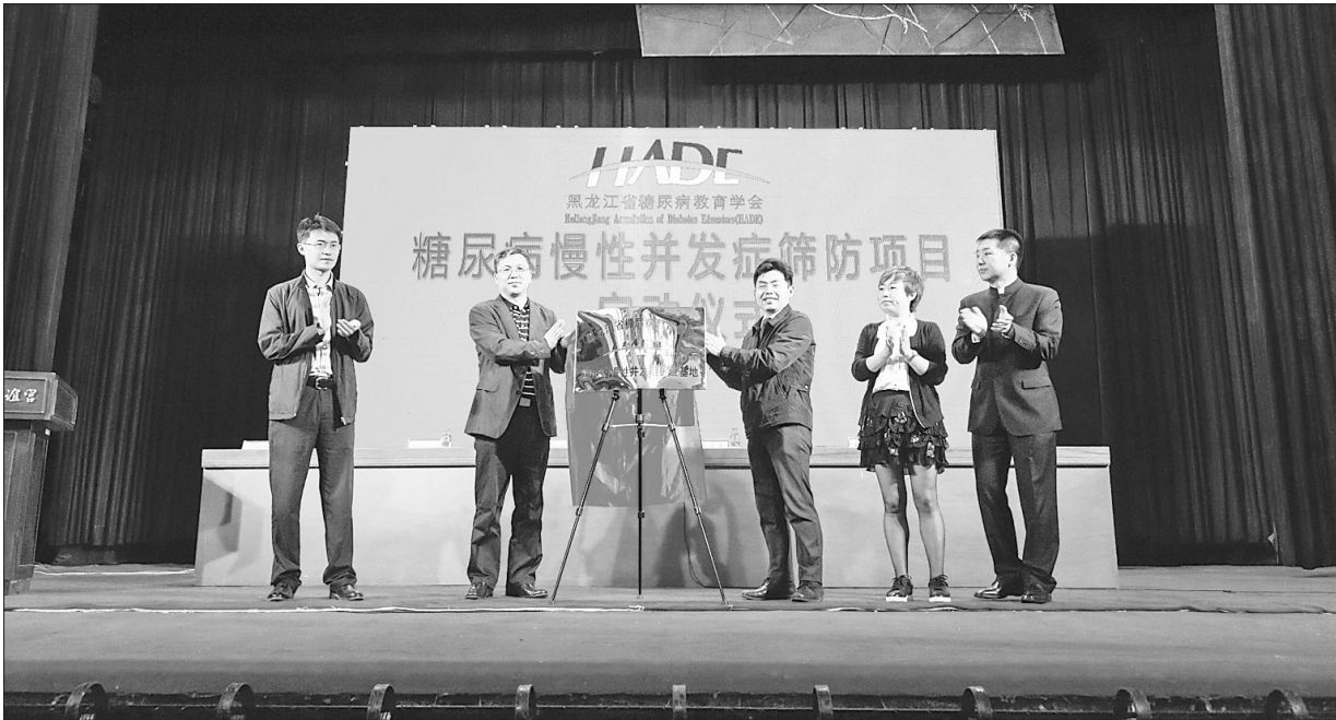
糖尿病慢性并发症筛查基地揭牌仪式。

省糖尿病教育学会通过与相关单位共建的“龙江讲坛·百年养生”科普平台品牌,大力宣传糖尿病(慢病)预防管理理念。另外,他们与省疾控中心共同承担起“健康龙江行动——健康管理糖尿病 影响龙江百万人”的慢病宣传工作,还被中国糖尿病防治工程指定为黑龙江糖尿病防治基地,为广大糖尿病(慢病)群体提供指标筛查服务。多年来,该学会与国内相关领域专家保持持续的学术往来,每年定期参与国内、外重大糖尿病(慢病)健康管理领域学术活动,为我省的糖尿病(慢病)健康管理事业提供强有力的学术支撑与教育管理方向。