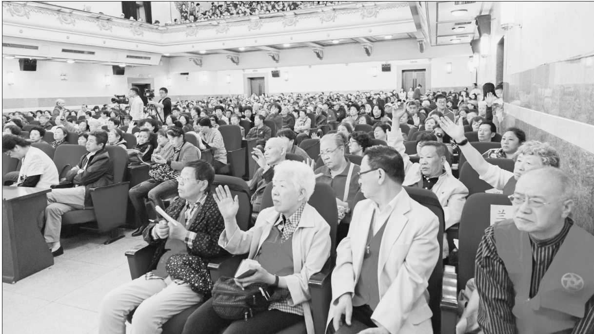
活动现场,市民与专家互动交流。