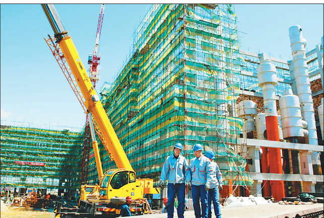
玉米精深加工项目施工现场。