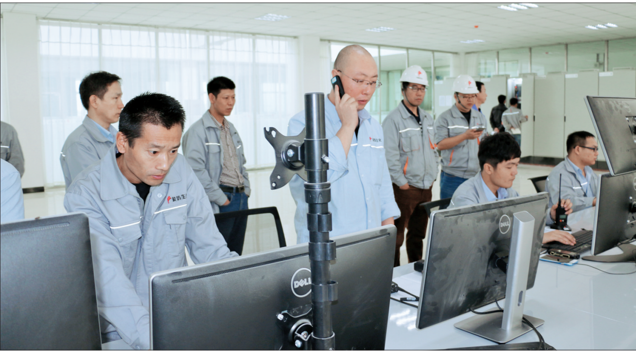
象屿生化60万吨玉米精深加工一期项目试运营现场。

基础设施建设情况：自2005年建设以来，产业园累计完成投资24.41亿元。在600公顷范围内已实现“五通一平”(道路、通给水、通排水、通电、通讯、平整土地)。还先后建成了配套完善的基础设施，其中66千伏变电站，总容量4万千伏安；供水厂日供水能力达到3万吨；污水处理厂日处理污水能力2.5万吨；