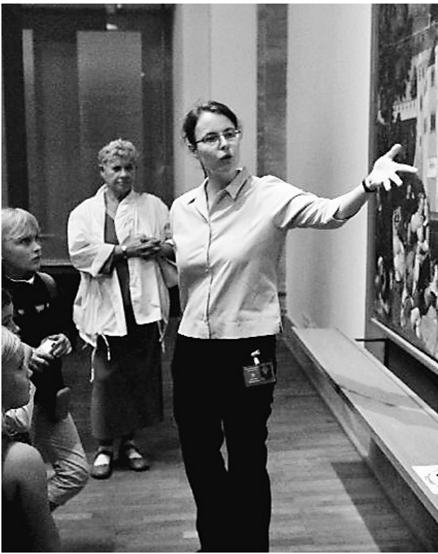
德国柏林的“博物馆之夜”活动,讲解员为前来参观的孩子们介绍馆藏展品。