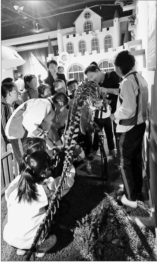
在黑龙江省博物馆奇妙的恐龙组装活动中,孩子们都跃跃欲试。