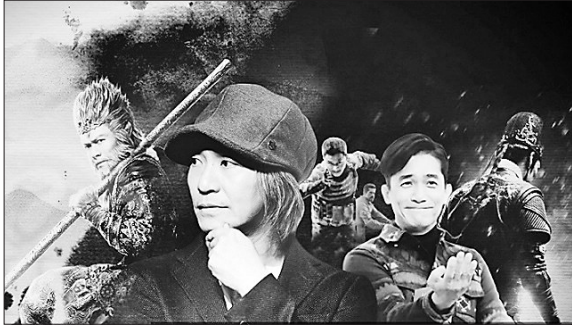
2017年,《捉妖记》、《美人鱼》等纷纷上马续集。