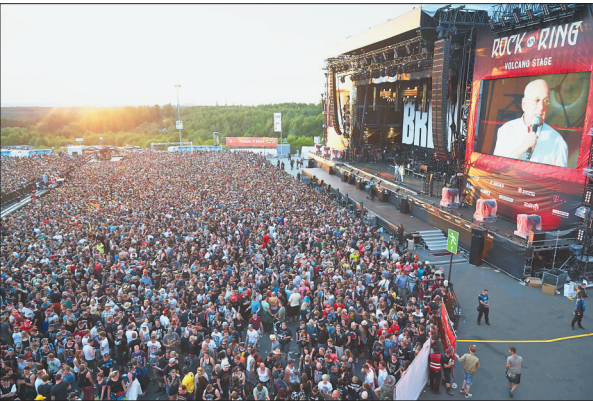
6月2日,在德国莱法州尼尔堡,观众离开音乐节现场。该音乐节活动当晚因恐怖袭击威胁而中断,现场数万观众被疏散。