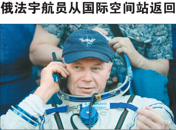
6月2日,在哈萨克斯坦兹卡兹甘附近,俄宇航员奥列格·诺维茨基在着陆后通电话。当地时间2日下午,俄法两名宇航员搭乘俄“联盟MS-03”载人飞船的返回舱从国际空间站平安返回地面,结束为期半年多的太空任务。