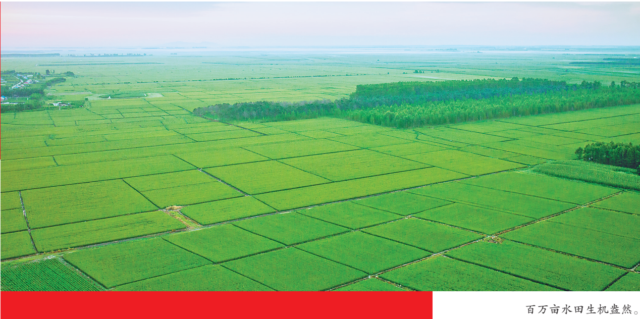
百万亩水田生机盎然。

智慧的绥滨人,依托两江一河冷水养殖优势,建设了国家级寒地淡水鱼养殖示范中心,网箱养鱼技术开创全省先河;肉鹅生产屠宰能力突破200万只,年出栏商品鹅80万只,产、加、销、技全产业链加速形成,鹅经济唱响20万人民的脱贫致富曲。