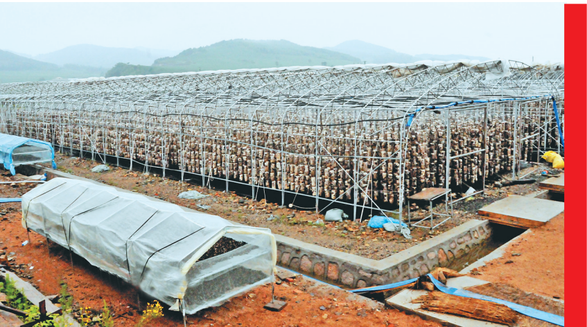
尚志市木耳栽培基地。