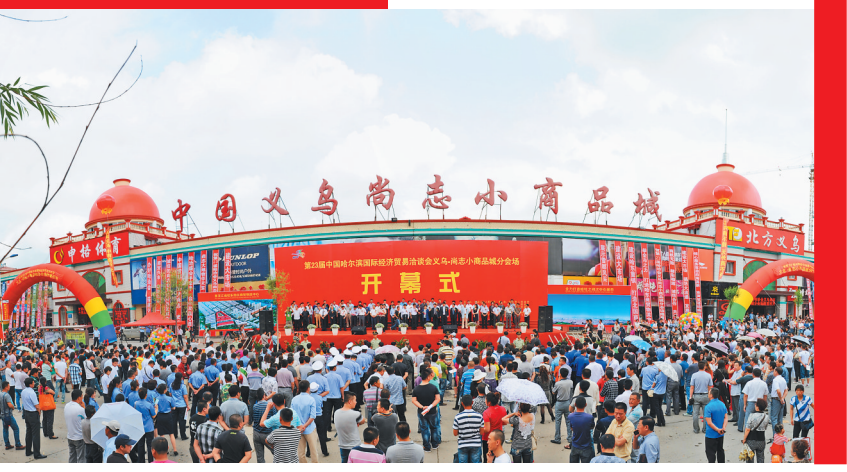
义乌·尚志小商品城。

第四届中俄博览会和第二十八届哈洽会义乌·尚志小商品城分会场经贸活动将于6月16日至6月18日在尚志市隆重举行。 尚志市是一个“八山半水分半田”的山区县市,总面积8825平方公里,辖10镇7乡,总人口62万人。尚志是国家一类革命老区,是国务院批准规划、正在建设中的哈牡之间唯一副中心城市,哈尔滨市重点打造的区域次中心。先后被评为“中国雪都”、“中国黑木耳之乡”、“中国红树莓之乡”、中国优秀旅游城市、黑龙江经济最具活力市(县)、黑龙江和谐可持续发展典型市(县)。 近年来,尚志市按照省市部署,抓产业、兴项目、转方式、调结构,主动抢占发展先机,县域经济保持良好发展势头。特别是新一届市委班子上任以来,立足经济社会发展大局,提出了打造“活力尚志、法治尚志、幸福尚志、清廉尚志”的发展目 标,对全市产业发展方向进行分析研判,重新确定了九大重点产业。本届分会场将重点推介以食用菌、浆果为主的绿色食品产业、木材加工产业和商贸物流产业。 自2009年开始,尚志市承办了9届“哈洽会”分会场活动,其中包括3届中俄博览会分会场。本届展会共设A、B、C、D、E五个展区。A区在义乌·尚志小商品城1楼,设置60个国际标准展位,重点展出义乌小商品,同时在本区域2楼设置进口商品对接馆;B区设在铁通公路东侧华农建材批发市场,设置标准展位67个,重点展示尚志市绿色食品及地工产品;C区设在腾飞商厦1楼,重点展出俄罗斯等进口商品;D区设在义乌·尚志小商品城2楼,设置科技馆,重点展出智能小家电、机器人等高科技产品,并融入电子商务产业内容;E区设在腾飞家具市场步行街,重点以汽车、农机展为主。