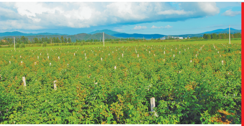
尚志市长荣红树莓种植基地。

第四届中俄博览会和第二十八届哈洽会义乌·尚志小商品城分会场经贸活动将于6月16日至6月18日在尚志市隆重举行。 尚志市是一个“八山半水分半田”的山区县市,总面积8825平方公里,辖10镇7乡,总人口62万人。尚志是国家一类革命老区,是国务院批准规划、正在建设中的哈牡之间唯一副中心城市,哈尔滨市重点打造的区域次中心。先后被评为“中国雪都”、“中国黑木耳之乡”、“中国红树莓之乡”、中国优秀旅游城市、黑龙江经济最具活力市(县)、黑龙江和谐可持续发展典型市(县)。 近年来,尚志市按照省市部署,抓产业、兴项目、转方式、调结构,主动抢占发展先机,县域经济保持良好发展势头。特别是新一届市委班子上任以来,立足经济社会发展大局,提出了打造“活力尚志、法治尚志、幸福尚志、清廉尚志”的发展目 标,对全市产业发展方向进行分析研判,重新确定了九大重点产业。本届分会场将重点推介以食用菌、浆果为主的绿色食品产业、木材加工产业和商贸物流产业。 自2009年开始,尚志市承办了9届“哈洽会”分会场活动,其中包括3届中俄博览会分会场。本届展会共设A、B、C、D、E五个展区。A区在义乌·尚志小商品城1楼,设置60个国际标准展位,重点展出义乌小商品,同时在本区域2楼设置进口商品对接馆;B区设在铁通公路东侧华农建材批发市场,设置标准展位67个,重点展示尚志市绿色食品及地工产品;C区设在腾飞商厦1楼,重点展出俄罗斯等进口商品;D区设在义乌·尚志小商品城2楼,设置科技馆,重点展出智能小家电、机器人等高科技产品,并融入电子商务产业内容;E区设在腾飞家具市场步行街,重点以汽车、农机展为主。