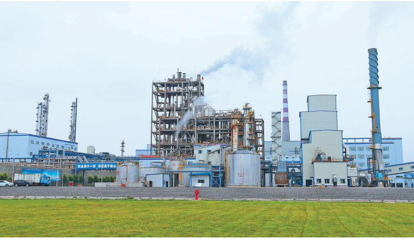
煤化工形成煤转电、煤制化肥、煤制天然气等多条产业链。

鹤岗市是一个资源丰富、风景优美的边境城市。北倚壮阔的黑龙江,与俄罗斯犹太自治州隔江相望,南街秀美的松花江,西枕苍茫的小兴安岭,东抱广袤的三江平原;地处黑龙江、松花江、小兴安岭“两江一岭”围成的金三角区域;幅员面积1.5万平方公里,下辖萝北、绥滨2个边境县和6个行政区,人口110万,城镇化率83%。 当前,鹤岗市大力培育和发展“绿色矿业、生态农业、文化旅游、外贸物流、战略新兴”五大产业,努力打造“龙江东部工业强市、中国北方鱼米之乡、中俄界江旅游胜地”,建设活力边城、幸福家园,转型发展进入新的历史机遇期。