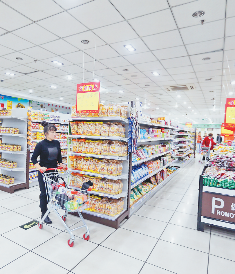
借助互联网,绿色食品种得好又卖得好。图为掌上超市线下实体店。