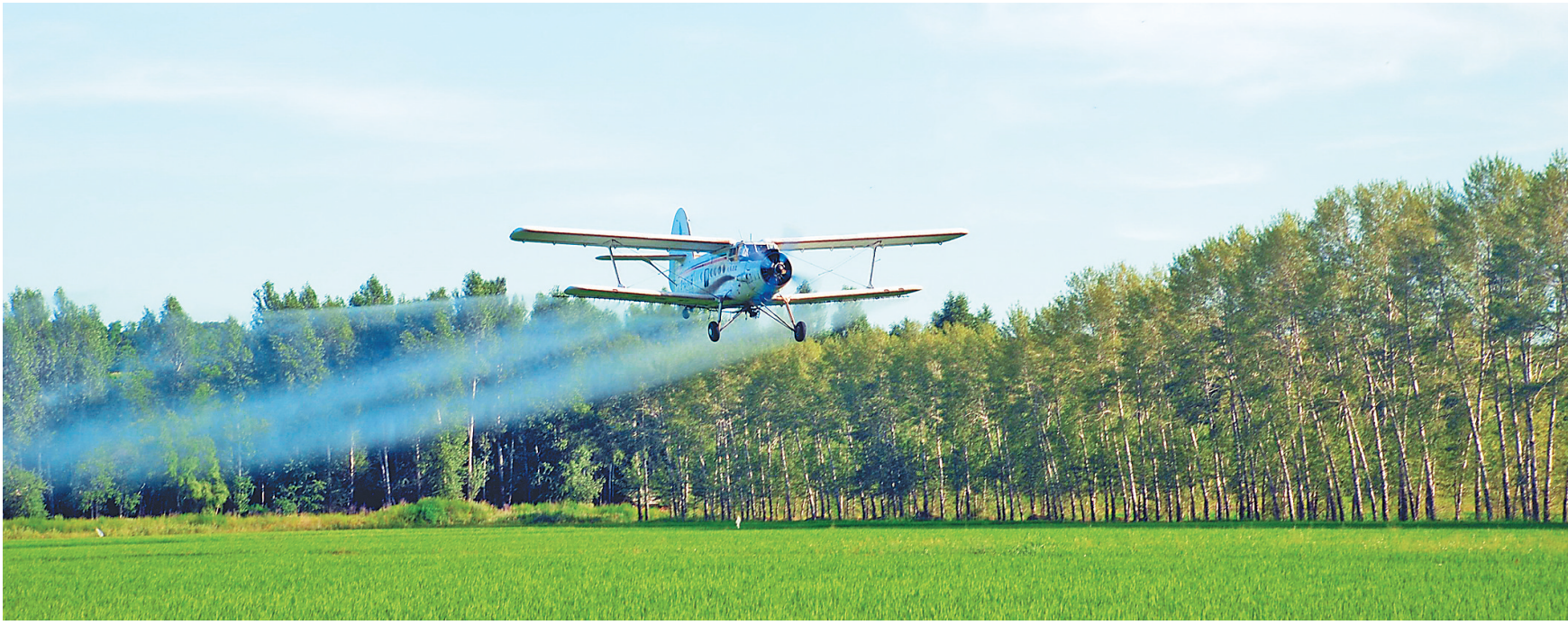
农业现代化水平不断提升。

今年鹤岗市计划推进实施千万元以上产业项目和500万元以上项目120个,其中亿元以上产业项目45个,年度计划固定资产投资65亿元,占全部固定资产投资105.5亿元的60%以上。首批开工73个项目总投资127亿元,固定资产投资106亿元,年度计划投资41亿元,亿元以上项目32个,40个项目年内计划建成投产。