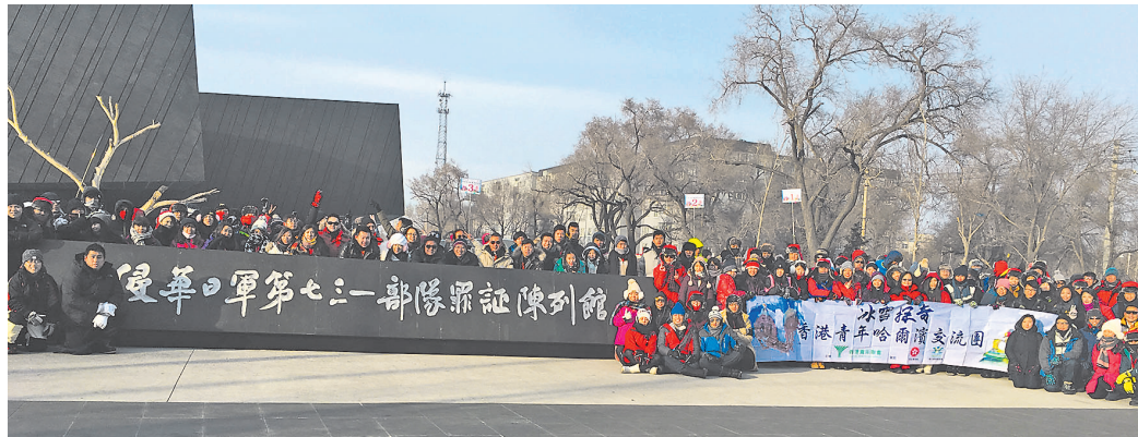
2016年1月,香港特区政府驻辽宁联络处人员陪同来访香港年青人前往侵华日军第七三一部队罪证陈列馆参观。

除了大学生以外,联络处还协助香港工程师学会土木工程分部组织青年工程师到东北三省进行交流互访。一众年青工程师千里迢迢从香港到访哈尔滨、长春、丹东和沈阳,并与清华大学的老师和同学一起交流。其间,大家理解到在北方进行建筑工程的特殊之处,其中包括时间限制等,与香港有很大不同。香港工程师学会还分别与哈尔滨工业大学、长春工程学院的老师和学生进行交流互动,并在沈阳实地考察了多个土木工程项目,获益良多。