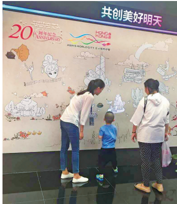
互动墙让观众以声、光、影体验香港特色。

为庆祝香港回归祖国20周年,香港特区政府驻京办联同驻天津联络处和驻辽宁联络处从4月至10月将举办多项精彩活动,与北京及其服务的其他九个省市(即天津、河北、黑龙江、甘肃、新疆、吉林、宁夏、辽宁和内蒙古)的市民一起分享共庆回归的喜悦。庆祝活动包括大型展览、巡回展、电影节、文化艺术演出等二十多项,为大家呈现多样的香港文化。