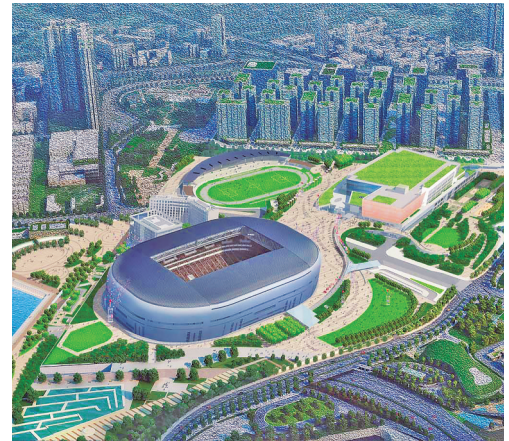
启德体育园效果图

体育可以强身健体,更可培养积极进取和团队合作精神,凝聚社会各界,促进社会和谐进步。特区政府发展体育亦不遗余力,既栽培精英运动员和推动普及体育,也增建大型体育基础设施及社区设施,促进体育长足发展。特区政府近年大幅增发资源,支持体育运动的“普及化、精英化、盛事化”。预计在未来五年,将投资200亿港元在全港18区增建或重建26个体育及康乐设施的项目,便利市民多做运动。占地约28公顷的