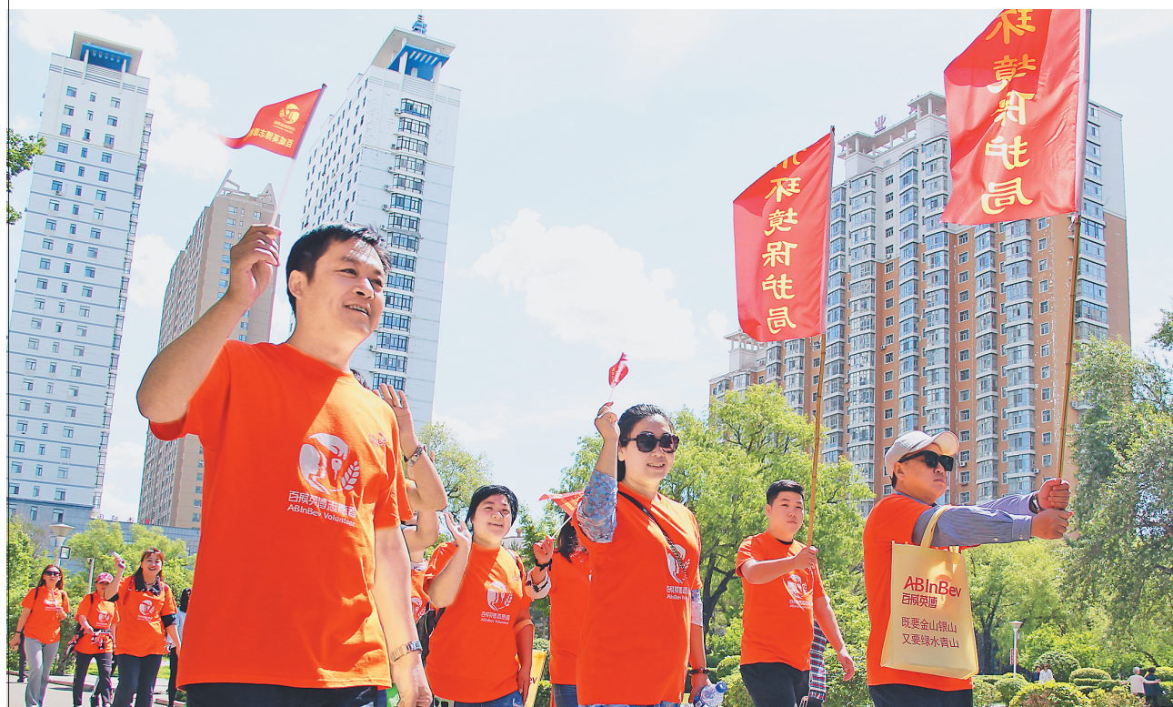
在第四十六个世界环境日当天,佳木斯市在杏林湖公园开展了“6·5”世界环境日大型主题公益活动。活动先后进行了环湖徒步、环保志愿者清理湖岸垃圾等。活动中,市水务局向主办企业百威英博(佳木斯)啤酒有限公司颁发了“自愿河长制”荣誉证书及河长制监督员荣誉证书。 图为环保志愿者环湖徒步。