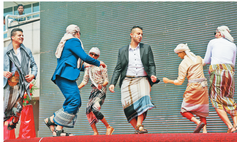
佳木斯大学“迎校庆”2017国际文化交流节隆重召开。本次国际文化交流节由国际教育学院留学生会和外国语学院学生会共同承办。国际教育学院、外国语学院有关领导、全体留学生及近千名各界群众参加了活动。留学生们还与现场观众进行互动游戏,同时还评选了“展区最佳布置奖”。在各国留学生齐唱歌曲中,国际文化交流节闭幕。

为了让农户放心流转土地,合作社按农户承包经营权的土地量化确权确权。红丰村把土地按质量分成高产田和低产田,农户的土地承包经营面积是按照高产田与低产田的各一半分配。农户持股数量的确定也是按标准亩按1股确定,1标准亩是按全村高产田与低产田所占比例混合计算,合作