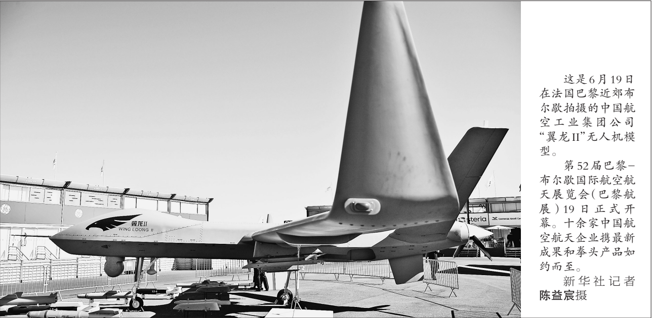
这是6月19日在法国巴黎近郊布尔歇拍摄的中国航空工业集团公司“翼龙II”无人机模型。