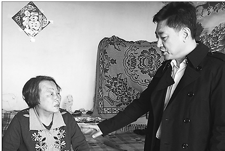
省中医药科学院领导班子对林甸县宏伟乡农民进行精准扶贫。

西、强创新”的九字方针,近十年来相继建设了南岗分院、香安院区、中药剂型改革中试基地、曲线社区卫生服务中心、国医堂、体检中心、治未病中心、临床心理中心、南岗分院全科医师培训基地和动物实验中心。建立健全各项规章制度,制定科研人员量化考核办法,行政后勤绩效考核办法,实行“一所两制”,成立祖研大健康产业有限责任公司和20多个专病研究所、教研室,管理创新,科学决策,使中医药科学院走上了一条医、教、研、产一体化的综合推进、科学发展的道路。