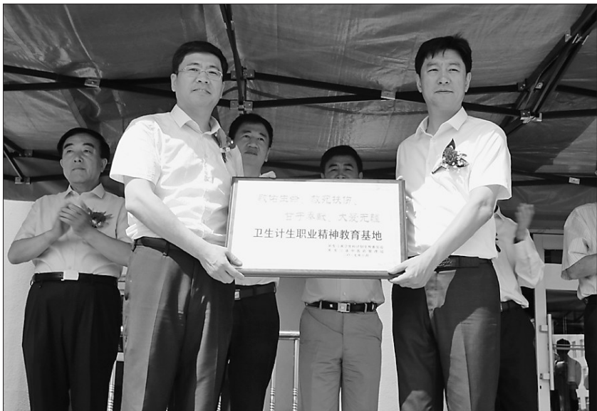
6月24日,国医大师张琪传承工作室被省卫计委授予省卫生计生职业精神教育基地称号。

在龙江的沃土上,一朵中医奇葩历经风雨依然青春绚丽,它承载着龙江中医药文化发展的神圣使命,也集聚了龙江中医药事业的荣光,它就是黑龙江省中医药科学院。回望它的历史,从“祖国医药研究所”(简称祖研),到“黑龙江省中医研究院”,再到如今的“黑龙江省中医药科学院”,每次名字的变更,都映衬着它内涵的提升和肩上责任的加重。六十年发展变迁,它由小变大、从弱到强,从单一的治病救人,到医、教、研、产一体化的综合推进,一路走来脚步愈加坚实;六十年重开甲子,全新的“中医药投身大健康”的发展理念,让它前行的视野更广、志向更高。 适逢建院60年之际,省卫生计生职业精神教育基地落户国医大师张琪传承工作室,院党委做出了在该院全体职工中开展向国医大师张琪教授学习的决定。为此记者走进了黑龙江省中医药科学院,切身感受它以国医大师张琪为代表的工匠精神,传承中医文化为己任的使命担当,以及新形势下现代中医药发展理念的锐意实践。