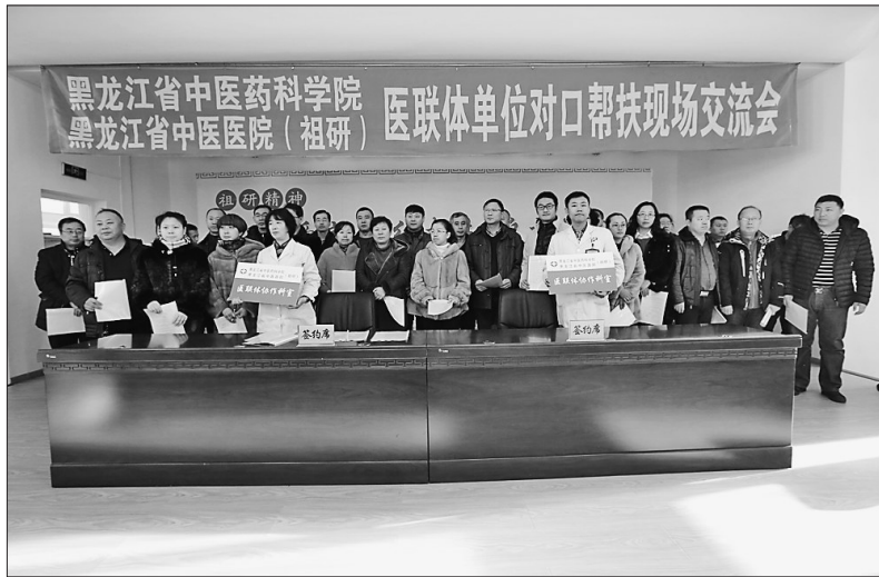
省中医药科学院主办医联体单位对口帮扶现场交流会。

育基地为依托,充分发挥省中医药疗联合体牵头单位的引领作用与辐射作用,走到基层,培养人才。成立国医大师张琪学术、文化、教育基地、张琪肾病专科医院和张老学生组成的专家宣讲团,充分发挥名老中医的榜样作用,进一步弘扬“敬佑生命、救死扶伤、甘于奉献、大爱无疆”的卫生计生职业精神。 “张老是我国著名的中医大家,他学术造诣深邃,临床经验丰富,蜚声国内外。如今95岁高龄,仍坚持出诊,治病救人,以实际行动践行了大医精诚、国之工匠的荣誉称谓。中医文化的发展重在传承。只有张老这样的名医带出更多高徒,才能让更多的百姓受益,让更多人喜欢上中医,中医传统文化的具体实践才有魅力,才能让中医事业稳步发展,中医文化生生不息。”王顺院长对此充满信心。