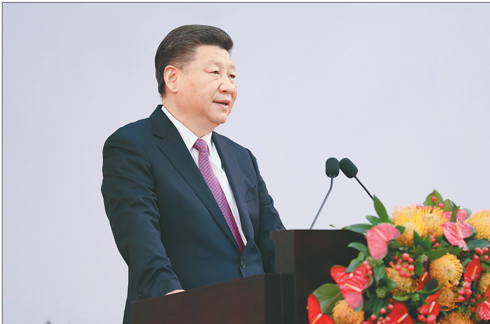
习近平发表重要讲话。

醒目。当习近平和夫人彭丽媛在香港特别行政区第五任行政长官林郑月娥和丈夫林兆波陪同下步入会场时,全场起立,热烈鼓掌。