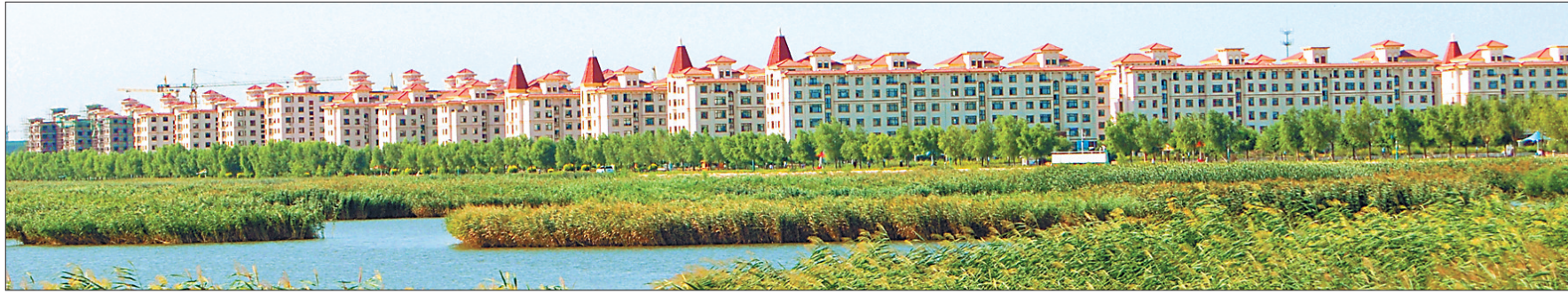
良好的绿色生态环境。

牌,下设特产、文史、平台、地名四类子品牌;为提高泰来大米、杂粮品牌影响力,强化品牌设计,用互联网思维提升设计品位,升级产品包装,引进了国内知名设计团队,将泰来特有“四种文化”元素融入产品包装设计当中;加强品牌推广,在现有天猫、京东等平台销售的基础上,与网易、铁途易购等平台合作;拓宽营销渠道,在哈西、齐南高铁站、哈大和嫩泰高速公路等重要节点,打出“泰来大米、天地粮心”广告,进一步扩大“泰来大米”的对外影响力。 泰来县坚持将电子商务作为振兴发展的新动力,运用“互联网+”思维,整合资源,统筹推进,县域电商呈现快速发展良好势头。据统计,到2016年末,泰来县网店已发展到300余家,微店3000余家,电商交易额突破9200万元,同比分别增长50%、50%和47%;全年快递包裹收发量115万件,其中发件量80万件,收件量35万件,同比分别增长167%、186%和133%,县域电商发展指数居齐齐哈尔市第一;在京东商城年交易额位居全省各县第一,被京东集团授予“东北大区标杆县”和“农村电商推广示范县”称号。