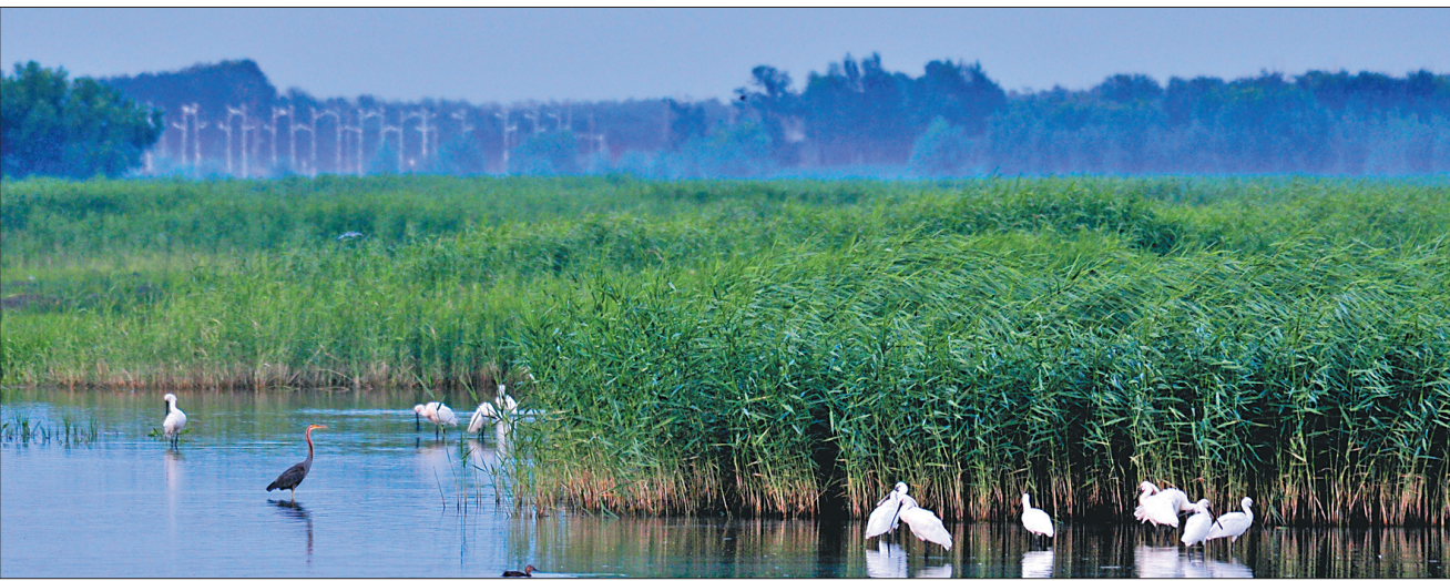
泰湖湿地成为鸟类的天堂。