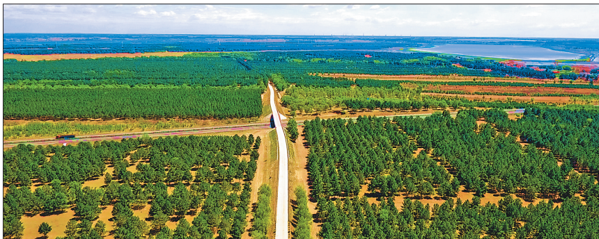
造林绿化让大地郁郁葱葱。

活,更是创造出了惊人的奇迹。曾经的“泰来县大沙包,风一刮地就擗,春种三遍地,难得半成苗”的谚语,已逐渐成为尘封的记忆。 随着生态环境的逐步改善,泰来县生态经济正在逐渐发展壮大。泰湖湿地公园被评为国家4A级景区,吸引了省内外越来越多的游客;三峡、华润、广源等一批新能源企业落户泰来,投资建设风电、光电项目,为打造绿色能源生态县注入了源源动力;汤池镇百大街村在400余亩林地种植的黑木耳,年产量可达4.5万斤。他们还在林地内放养2000余只鹅,效益十分可观。江桥镇将200亩樟子松嫁接红松,按每亩保存红松40株、每株结松塔20个,每个松塔5元初步估算,仅红松塔亩均收益400元;东方红林场建立占地面积580亩的林果产业经济示范区,分为林果生态观光采摘园、沙棘采摘园、樟子松嫁接红松苗木栽植实验区、长柄扁桃引种实验区、大果榛子栽植示范园、绿化造林苗木繁育区,在全县范围内发挥生态经济林示范作用。林子长起来了,生态环境好了,百姓的腰包也慢慢鼓起来了。 经过全县人民的不懈努力,困扰几代人的黄沙土如今已被一道道绿色屏障所遏制,良好的林业生态优势逐渐转化为生态农业、生态工业、生态旅游等生态经济优势。在勤劳的泰来人民努力下,绿水青山正在成为脱贫致富的金山银山,“塞北江南、花园之城”的泰来,将变得更加富饶美丽多彩。