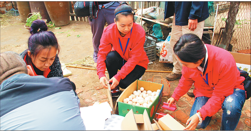
赶集小站工作人员将村民出售的产品进行打包。