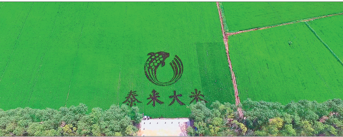
壮观的“泰来大米”稻田画。

泰来县位于我省西南部,地处黑、吉、蒙三省(区)交界处,素有“鸡鸣三省”之称。面积3996平方公里,人口32万,辖8镇2乡、83个行政村、532个自然屯。这里交通便利,平齐铁路、齐泰高速公路贯穿全境。这里物产丰饶,美丽的嫩江从泰来腹地流过,盛产鲢、草、鲤、“三花五罗”等地产名鱼,泰来大米、绿豆、“四粒红”花生远近驰名,享有“鱼米之乡、绿豆之乡、花生之乡”的美誉。千川汇海阔,风好正扬帆。2017年,泰来县站在新的发展起点上,承载快速发展的重任,解放思想,真抓实干,努力打赢脱贫攻坚战。