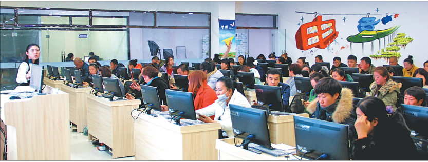
电子商务人员培训现场。