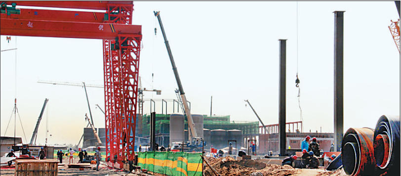
阜丰集团300万吨玉米深加工项目开工建设。