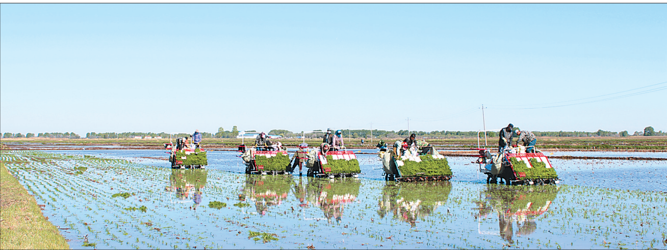
万亩无公害水田机械化插秧。