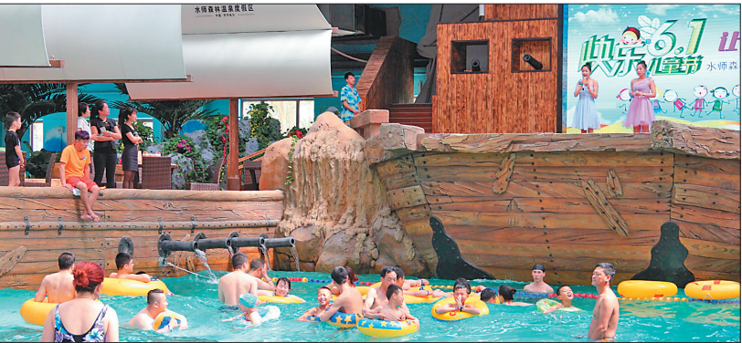
水师森林温泉度假区吸引众多游客。