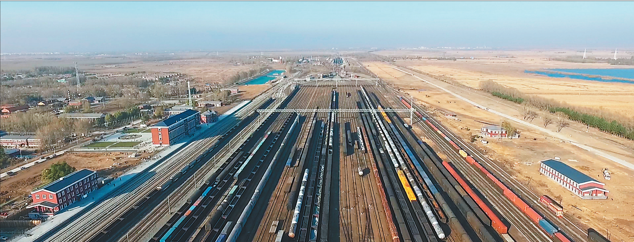
规划建设三间房国际经贸物流园区。