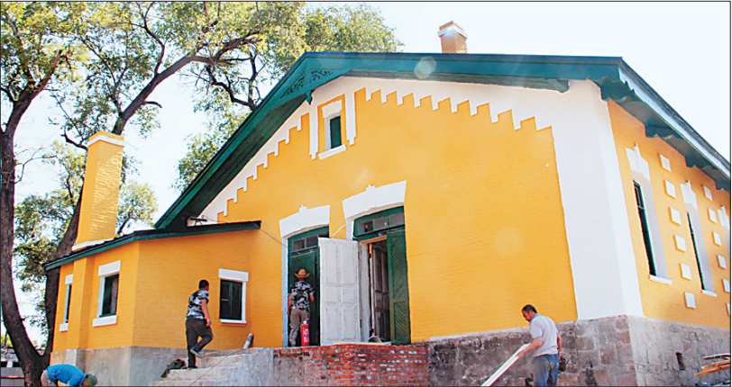
罗西亚大街俄式民居舍新修缮。