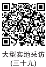
大型实地采访(三十九)