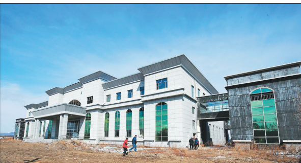
建设中的兴安连釜口岸新大楼。

兴安镇,几年前还是大兴安岭深处、中国北疆漠河县的一个默默无闻的农业小镇。随着中俄原油管道的建设,这条我国北方重要的能源大动脉的投入运营,使得漠河口岸一跃成为全省过货量最大的能源战略通道。“油龙”入境的第一站兴安也因“油”而兴。