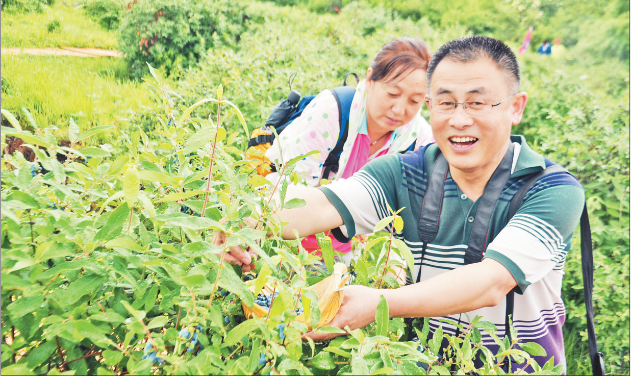
□姚琦 黄晓慧 本报记者 文天心

本报讯(臧世家 姚琦 记者文天心)为了扶持石墨产业的发展，七台河市新兴区采取超常规措施，全面加快七台河高新区新材料产业园建设，积极为投资企业提供优良的人驻环境。 新兴区石墨产业发展定位于以石墨烯应用为主的高端产业，坚持高点进入、高标准建设，加快推进石墨产业科技成果转化，着力打造蓄能材料、环保材料、超硬材料、石墨制品等产业链，重点打造5万吨锂电负极材料产业集群、石墨烯下游应用产业集群、高端石墨深加工特色产业集群三个集群，共19个项目。园区占地面积405公顷，已建成1.16万平方米孵化器两栋，在建1.2万平方米园区孵化器两栋，铺设白色路面11.5公里。通过一批重大项目的建设实施，到2030年，相关产业规模可达到100亿元。目前，宝泰隆石墨新材料有限公司已成功建成了年产100吨石墨烯工业化生产线。 为了扶持园区内新材料新能源项目发展，市、区政府积极推进放管服改革，努力营造良好的营商环境，大力精简行政审批事项，仅保留市本级行政审批事项195项，减少审批前置件172个，服务窗口全部实行“四零承诺服务”，全力服务招商项目和扶持企业发展，全力助推产业持续健康发展。 新兴区积极协调企业加强与国内科研院所的合作，为发展石墨烯产业提供强有力的人才和科技支撑。宝泰隆新材料公司已与石墨烯制备核心技术专家加盟，与清华大学、哈尔滨工业大学、东北石油大学、黑龙江科技大学等院校和科研机构建立合作关系，依托宝泰隆(北京)研发中心、黑龙江宝泰隆新材料新能源研究院和省级企业技术中心，针对石墨烯、石墨烯衍生品及下游应用产品进行技术研发，经国家知识产权局受理和批准专利共16项。