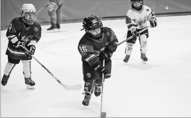
进入暑期,哈尔滨市八区体育馆、省冰上基地等专业冰上运动场馆对外开放,吸引了大批青少年走进冰场。这些上冰训练的孩子是省冰上运动未来的希望,也是我省持续发展冰上运动必不可少的一股力量。