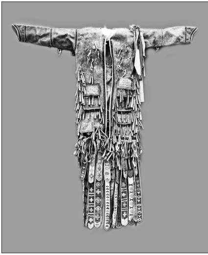
清代鄂伦春族驼鹿皮,现藏于黑河博物馆。