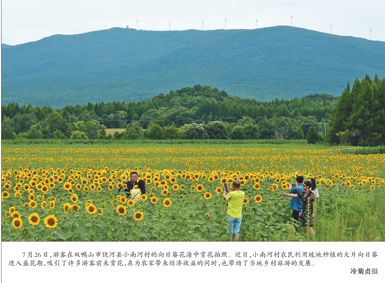
7月26日,游客在双鸭山市饶河县小南河村的向日葵花海中赏花拍照。近日,小南河村农民利用坡地种植的大片向日葵进入盛花期,吸引了许多游客前来赏花,在为农家带来经济收益的同时,也带动了当地乡村旅游的发展。

如今,上至耄耋老人,下至孩童,都在关注《魅力中国城》,并参与其中。老人在子女的教授下,认真投票;孩子在父母的手把手中,为《魅力中国城》点赞……山城已经营造出了人人参与和支持的良好氛围,共同为推动双鸭山竞演《魅力中国城》网络投票进行加温、鼓励。