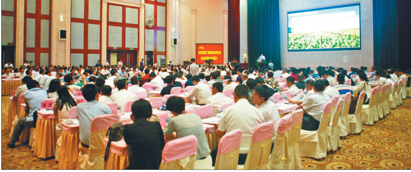
图为第二届双鸭山经贸合作企业家恳谈会现场。

恳谈会举行了项目签约仪式。双鸭山市与部分代表团就环保产业园固废综合处理、金谷仓储物流建设等10个项目进