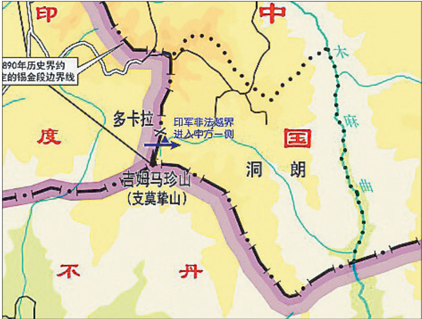
印军越界地点示意图