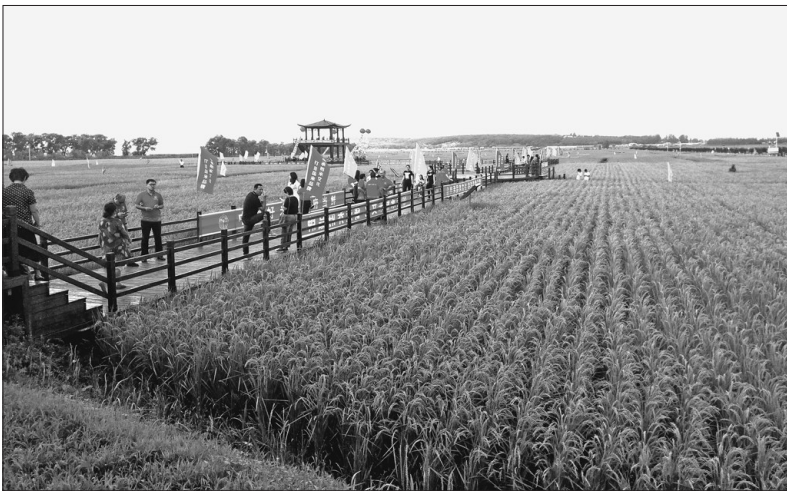
五常稻花香生态体验园。