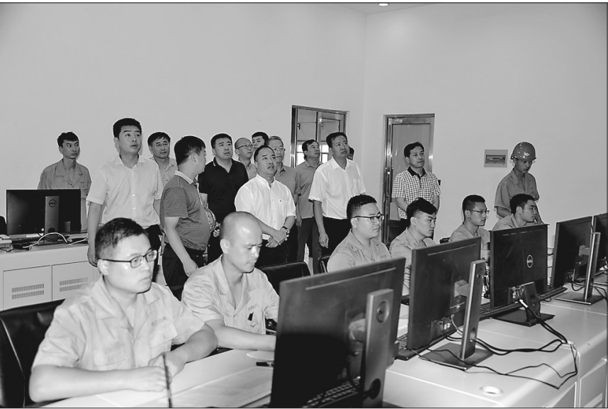
尚志市领导带队查看中鑫热电有限公司二期生物质发电项目。