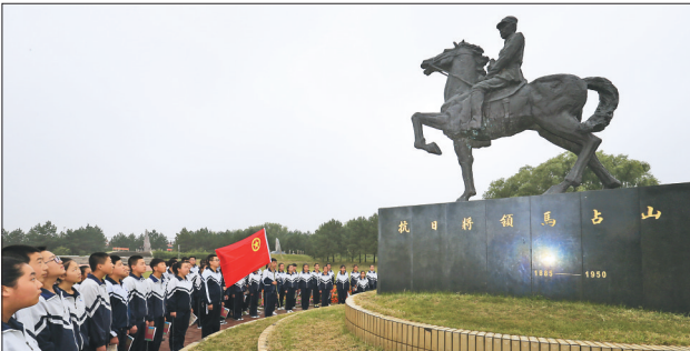
齐齐哈尔江桥蒙古族镇学生缅怀英烈。