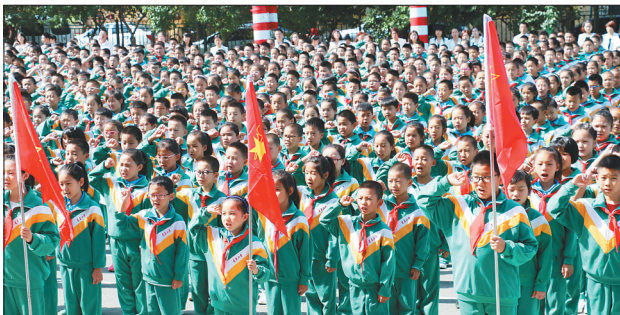
佳木斯光复小学举行主题校会。