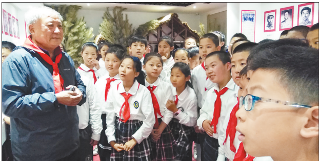
孩子们在牡丹江大学博物馆参观。