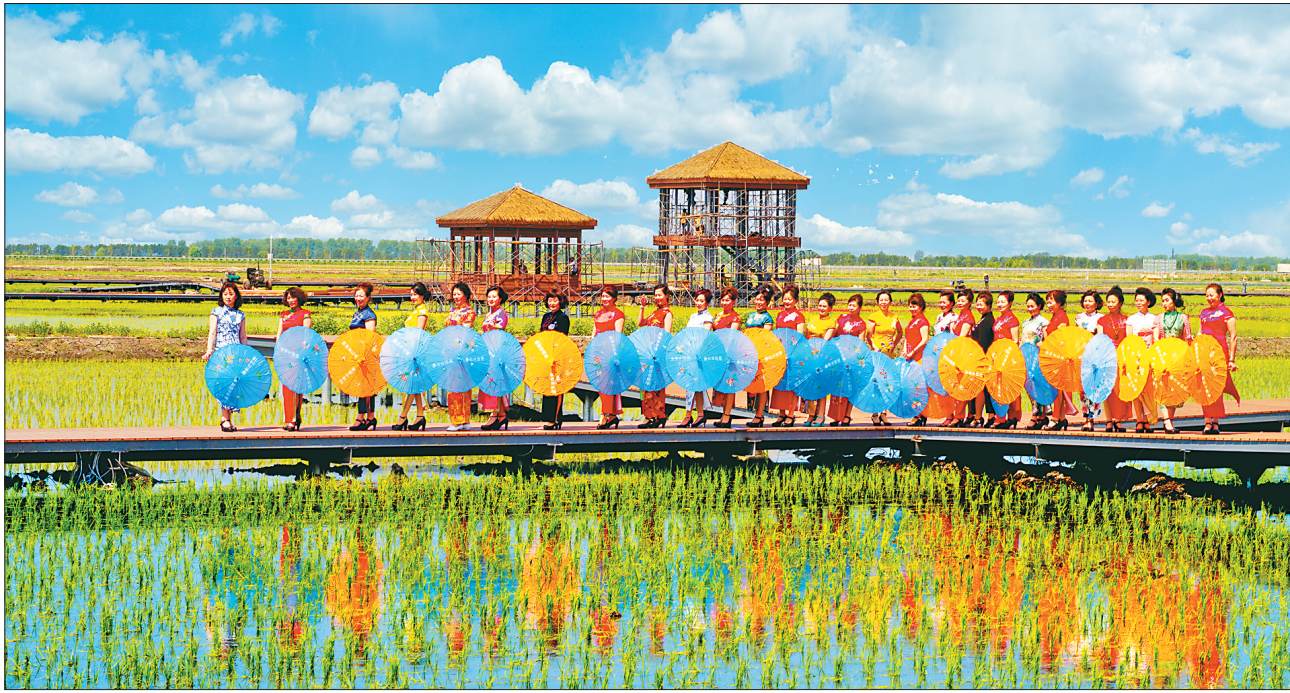
万亩水稻公园上演旗袍秀。

富锦市长安镇长安果蔬市场是稻海田园综合体的配套项目之一。长安镇结合自身区位优势,抓住商机,调整结构,在农民增收上苦下功夫,切实将旅游+农业的理念落到实处。果蔬市场内集中了长安镇各村屯众多特色农