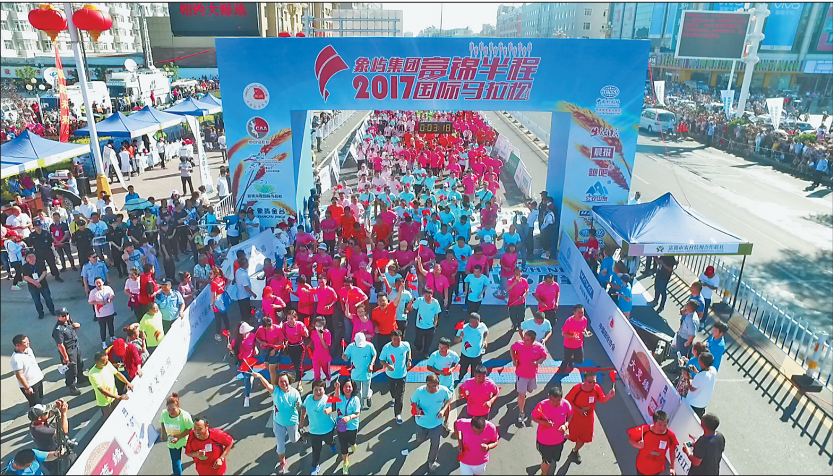
象屿集团2017富锦半程国际马拉松比赛现场。

人的有效人数挑战吉尼斯世界纪录称号最多一起扭秧歌成功。在满天红霞黄昏傍晚,富锦广场的秧歌舞蹈,绘成了夜幕下富锦市一道亮丽的风景线。夜幕下的富锦城灯火辉煌,锣鼓喧天,亮丽多彩,姹紫嫣红,可谓“东风夜放花千树,火树银花不夜城”。“中国北方秧歌城”也成为富锦这座城市最靓丽、最具特色的城