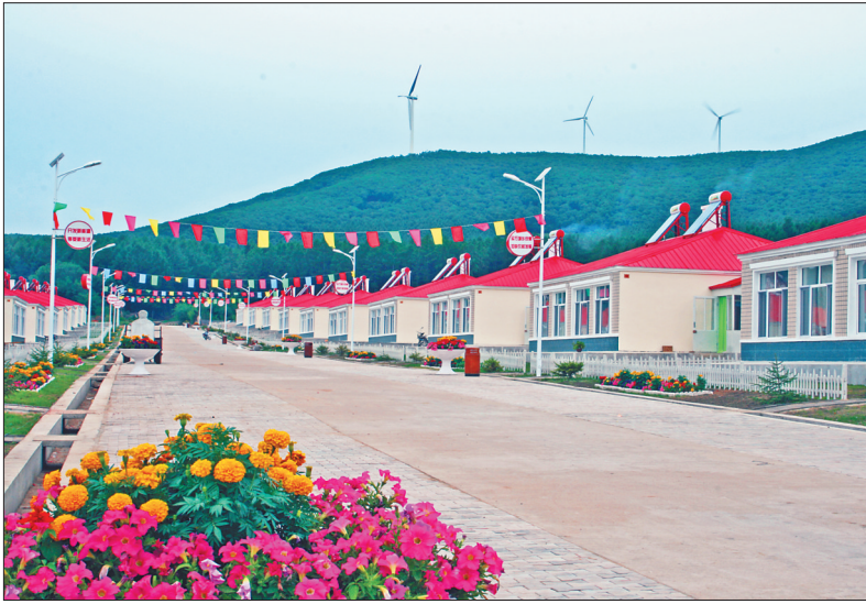
新农村建设标杆——工农新村。