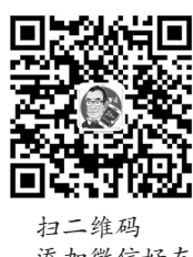
扫二维码 添加微信好友