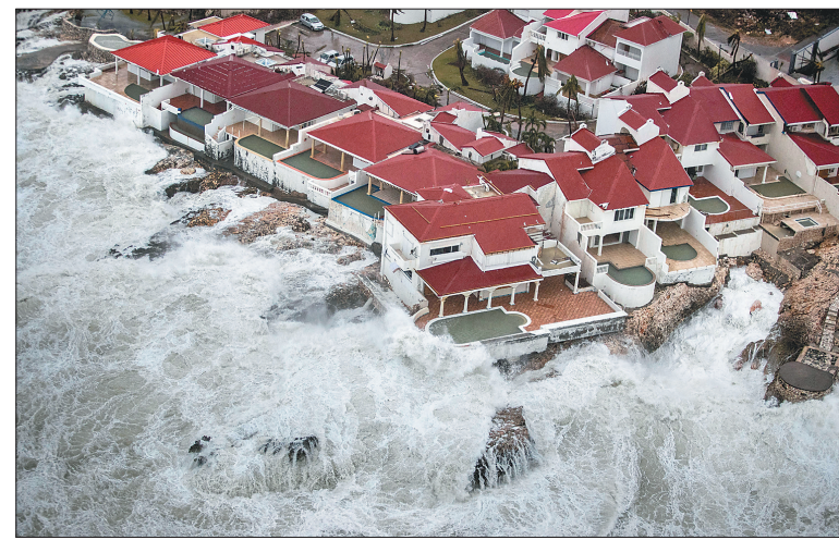
据新华社巴黎9月7日电(记者韩冰)法国内政部长热拉尔·科隆7日接受媒体采访时说,位于加勒比海的法属圣马丁岛遭受飓风“艾尔玛”重创,初步统计已有8人死亡、23人受伤。