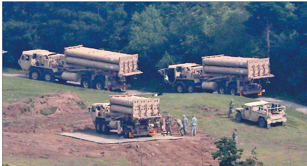
这是9月7日在韩国庆尚北道星州郡一个高尔夫球场拍摄的“萨德”相关装备。

新华社韩国星州9月7日电(记者耿学鹏 姚琪琳)在经过与反“萨德”民众激烈冲突后,7日晨,美国和韩国军方将“萨德”反导系统剩余4台导弹发射车及相关物资运入韩国庆尚北道星州美军“萨德”基地。按照韩国国防部的说法,美韩至此已完成“萨德”系统在韩的“临时”部署。是否最终部署“萨德”系统,将依据对全部部署用地的普通环评结果作出决定。不过,此前有韩方官员称,环评计划并不