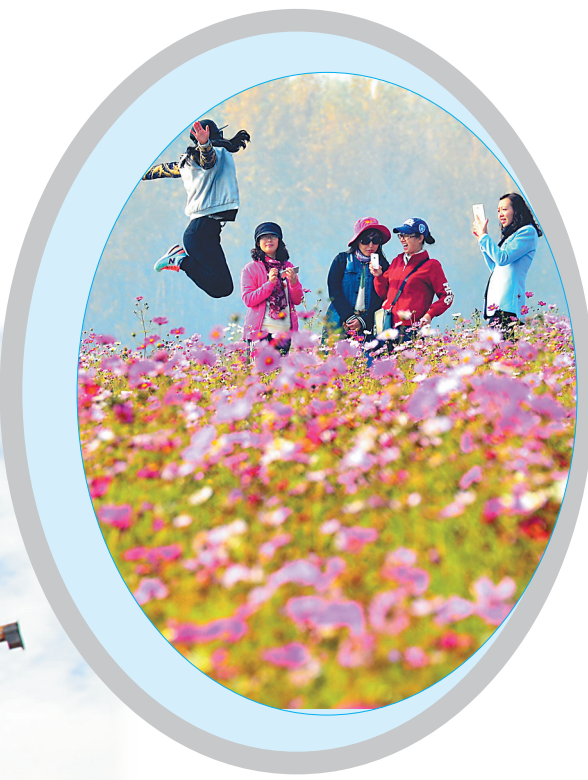
太阳岛上花海人笑。