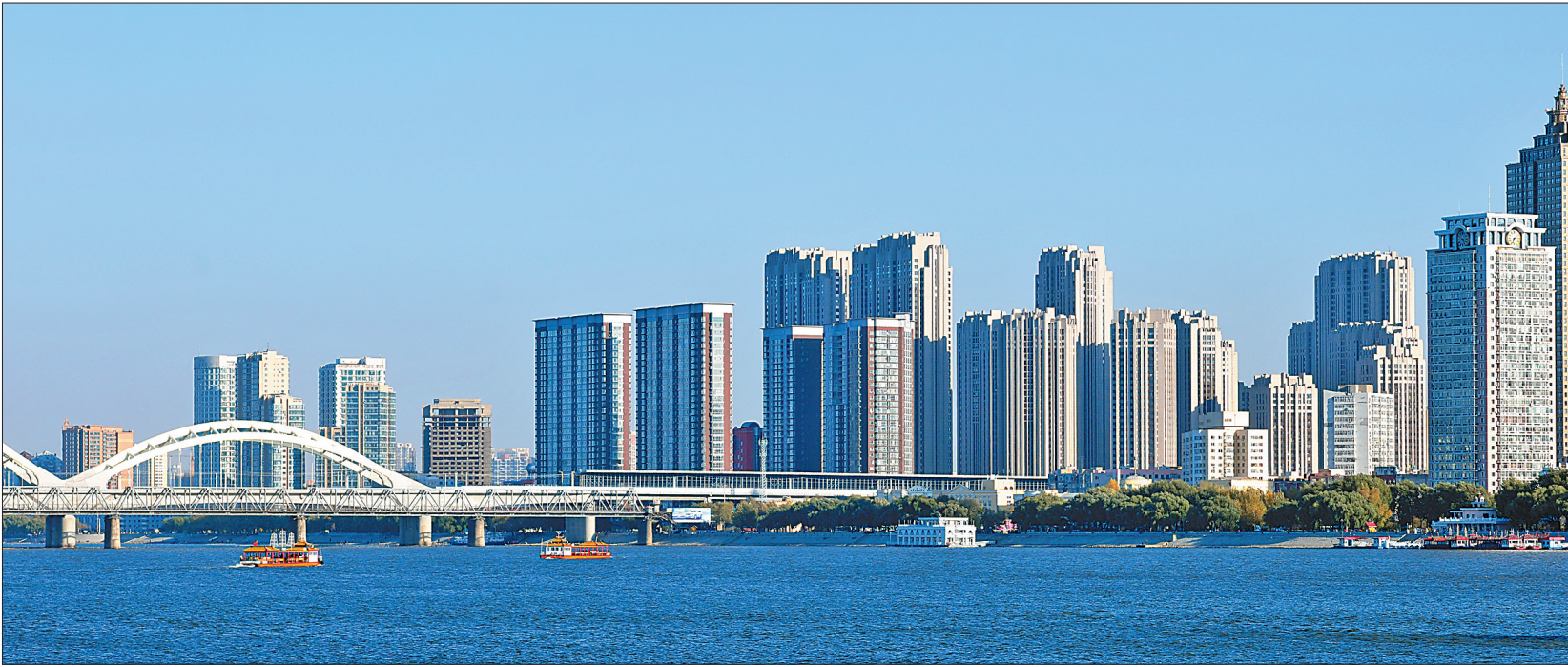
城市面貌日新月异。