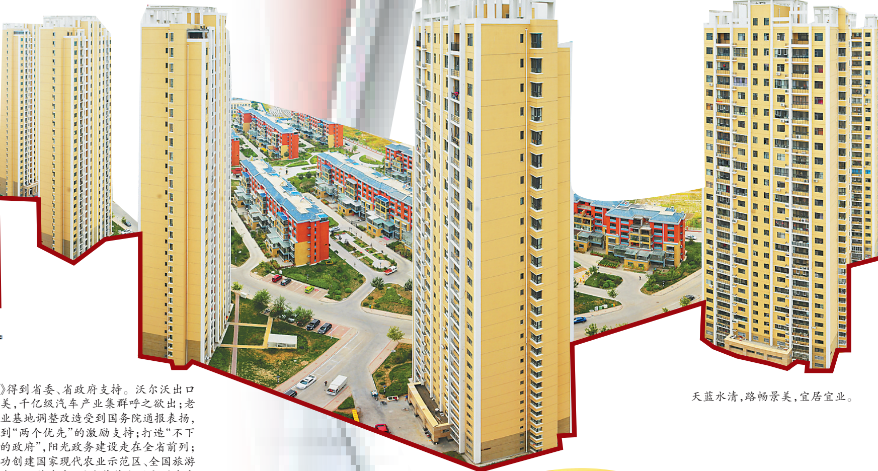
天蓝水清,路畅景美,宜居宜业。