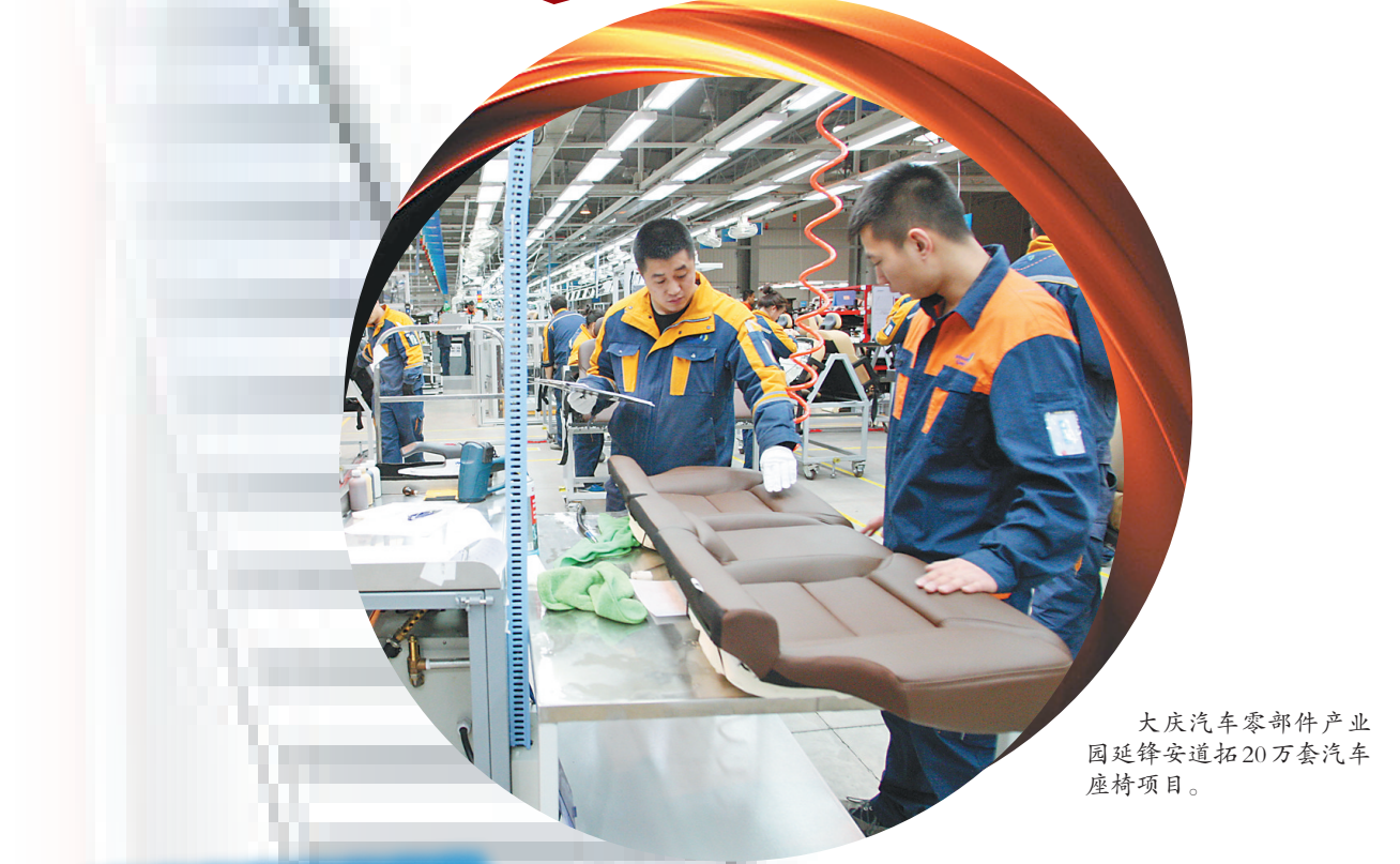
大庆汽车零部件产业园延锋安道拓20万套汽车座椅项目。

实现经济、城市、生态、体制、社会治理“五个转型”。争当经济转型排头兵,加速推动能源主导的单一型经济向多元综合型经济跨越升级,重点培育油气、“油头化尾”、汽车、电子信息、中高端食品、新能源、新材料、现代农业、现代服务业、新经济10个“雁阵式”产业板块,形成5个超千亿元产业、5个超五百亿元产业集群。争当城市转型排头兵,加速推动矿区型城市向现代都市型城市跨越升级,集聚人口规模,扩大对外开放,提升城市品质,推进市场化运营,建设“数字城市”,缩小城乡差距。争当生态转型排头兵,加速推动粗放消耗型生态向绿色低碳型生态跨越升级,构筑生态安全机制,塑造绿色空间,发展绿色低碳产业,推进新能源和可再生能源开发利用。争当体制转型排头兵,加速推动相对内向型体制向纵深开放型体制跨越升级,构建大庆地企新型生产关系,做强国家级产业园区,用好域内外两种要素资源,支持民营经济做大做强。争当社会治理转型排头兵,加速推动集中式管理型治理向协同互动型治理跨越升级,建设幸福大庆、信用大庆、法治大庆、文明大庆。