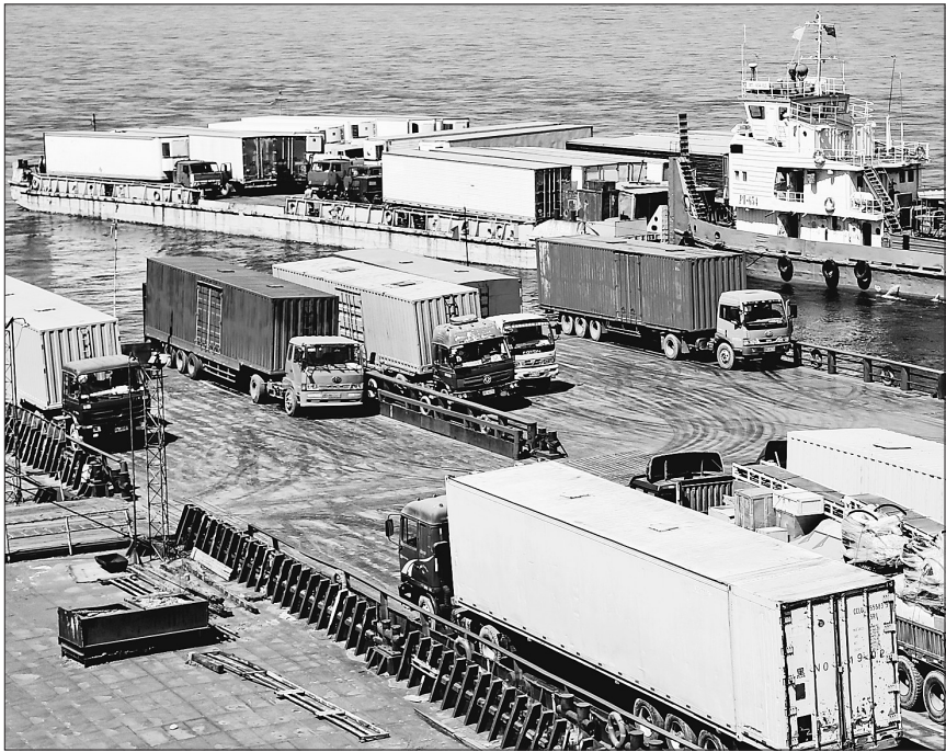
中俄贸易带动了口岸城市快速发展。图为繁忙的黑河港。