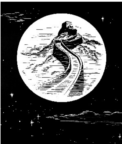
张地茂《月是故乡明》 版画