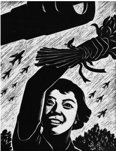
黄新波《敬礼，人民的战士！》 石膏版 30×23cm

我们 曾是水珠一滴， 为了远方的呼唤， 演绎波澜的传奇。 带着向往奔流不息， 那是因为——海在那里！