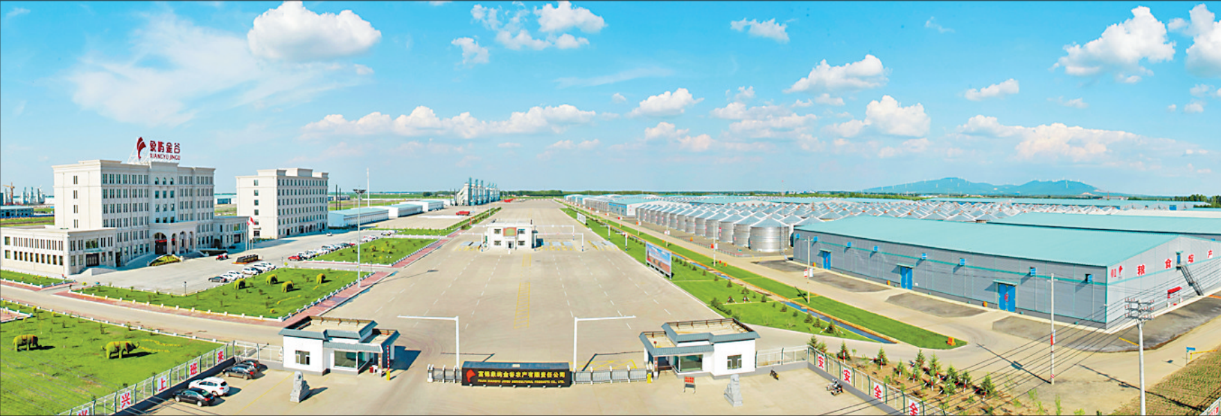
象屿金谷农产品生产基地。

坚持问题导向抓改革。围绕规范运行机制、规范机关单位选人用人、提高工作效率、杜绝廉政风险,在资源、规划、财经、项目等相关领域进行自查自纠,对体制机制进行改革。新设立了招投标办,改变过去多头招标、不规范招标和“三边”工程现象;设立了政务服务中心,将政府采购等职能从财政剥离,解决了财政部门“既当运动员、又当裁判员”问题;出台了《财政资金管理暂行办法》、《政府投资项目管理办法》等相关制度,成立了富锦市委财经工作领导小组,对投融资、资产处置等重大事项进行规范管理。