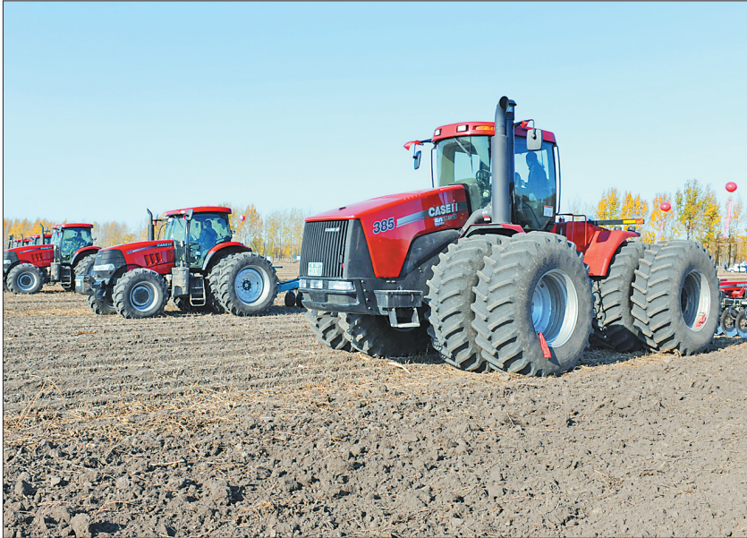
改革创新推动现代农业生产全程机械化。