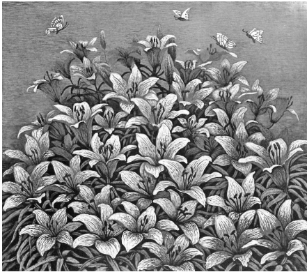
《吉祥百合》 版画 张静梅

还能说什么呢？正像她在小说集后记中所说的那样，人是可以透过文字活出来的。的确，文学可以让生命如此的灿烂！